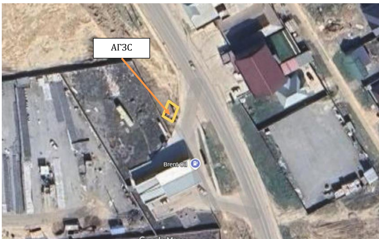
Рис 1. Ситуационная карта района расположения объекта.