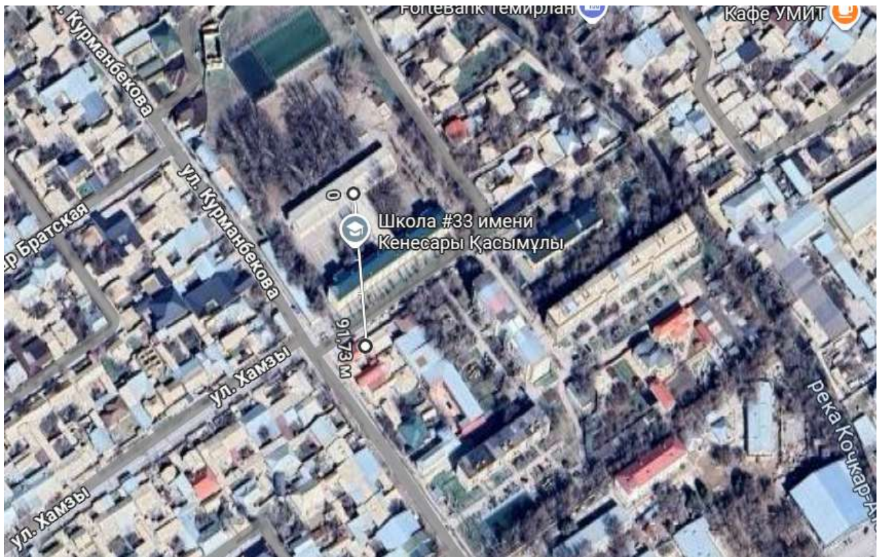
С юго-запада – На расстоянии 101,97 м жилой дом.