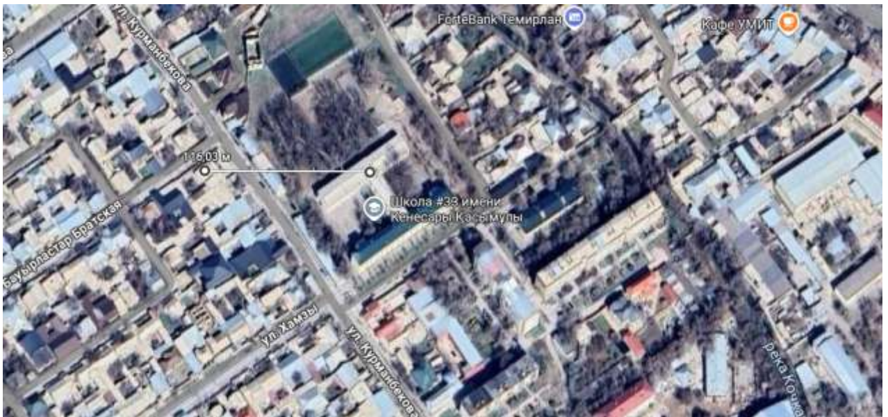
С северо-запада – На расстоянии 103,36 м жилой дом.