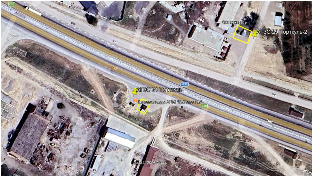
Рис.1. Ситуационная карта-схема проектируемого участка