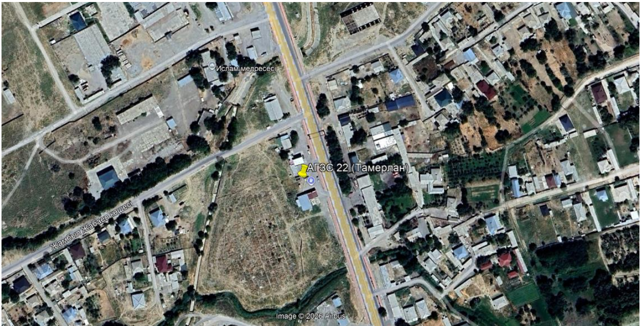
Рис.1. Ситуационная карта-схема проектируемого участка