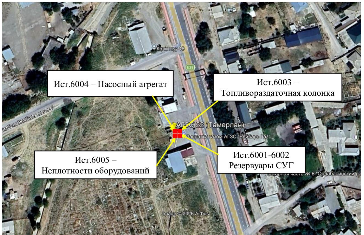
Рис. 1.1. Карта-схема объекта с нанесенными на нее источниками выбросов загрязняющих веществ в атмосферу