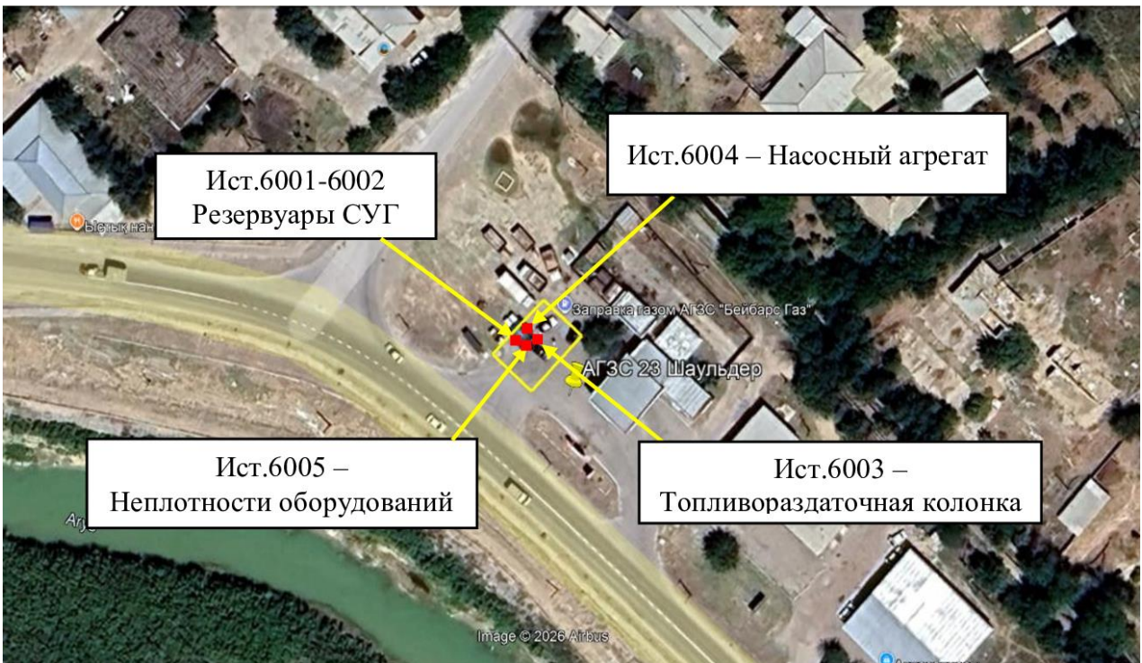
Рис. 1.1. Карта-схема объекта с нанесенными на нее источниками выбросов загрязняющих веществ в атмосферу