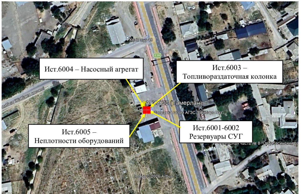
Рис. 1.1. Карта-схема объекта с нанесенными на нее источниками выбросов загрязняющих веществ в атмосферу