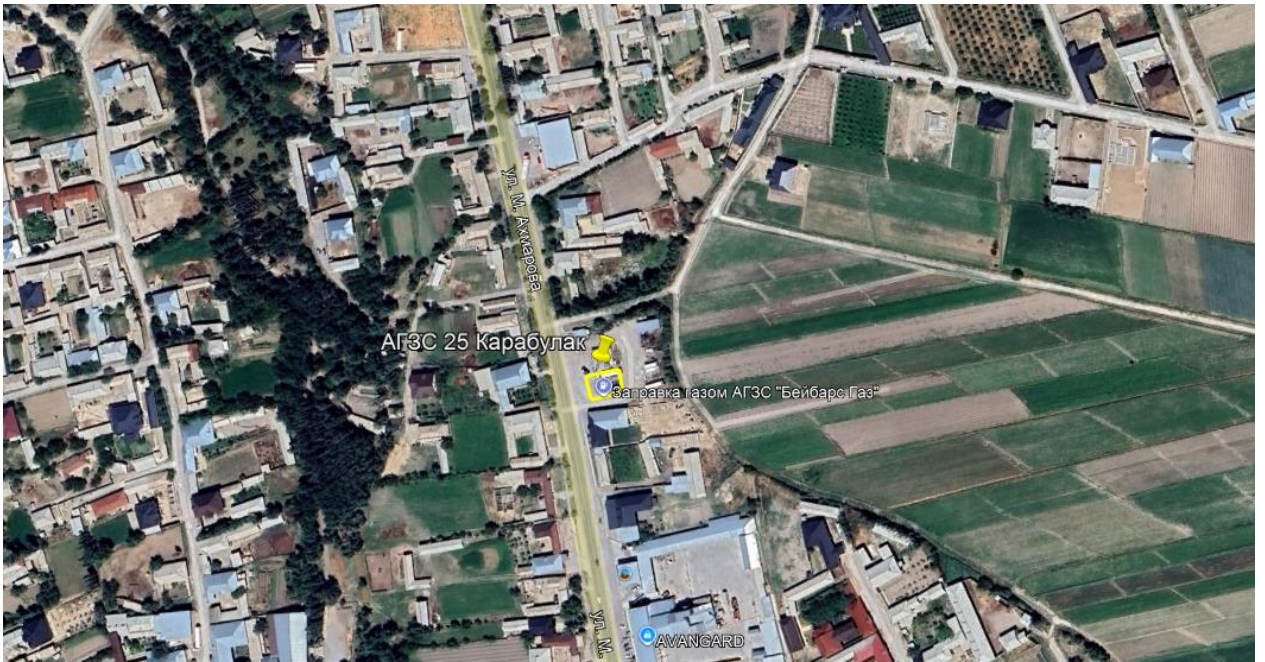
Рис.1. Ситуационная карта-схема проектируемого участка