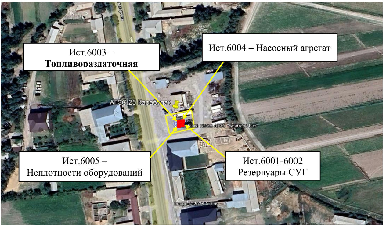
Рис. 1.1. Карта-схема объекта с нанесенными на нее источниками выбросов загрязняющих веществ в атмосферу