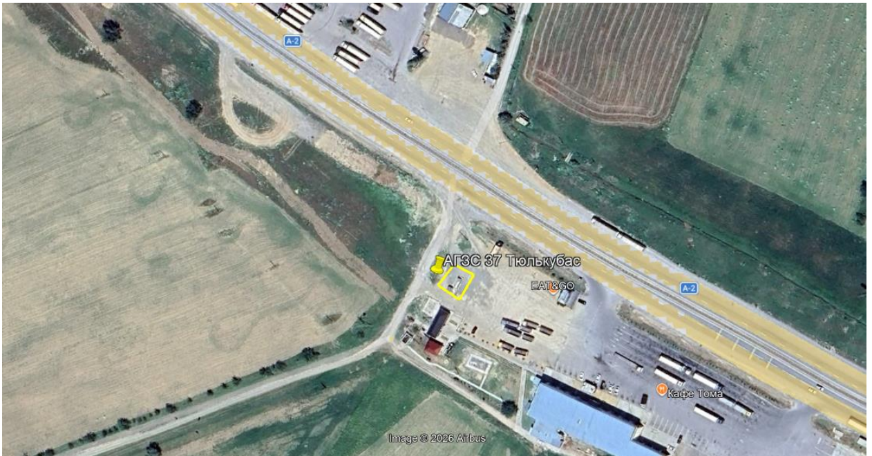
Рис.1. Ситуационная карта-схема проектируемого участка