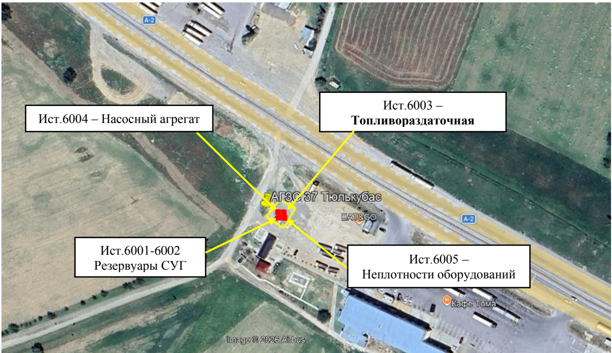
Рис. 1.1. Карта-схема объекта с нанесенными на нее источниками выбросов загрязняющих веществ в атмосферу