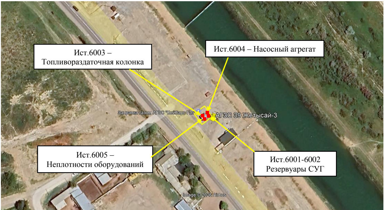
Рис. 1.1. Карта-схема объекта с нанесенными на нее источниками выбросов загрязняющих веществ в атмосферу