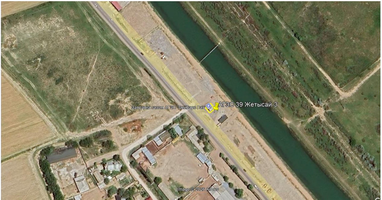
Рис.1. Ситуационная карта-схема проектируемого участка