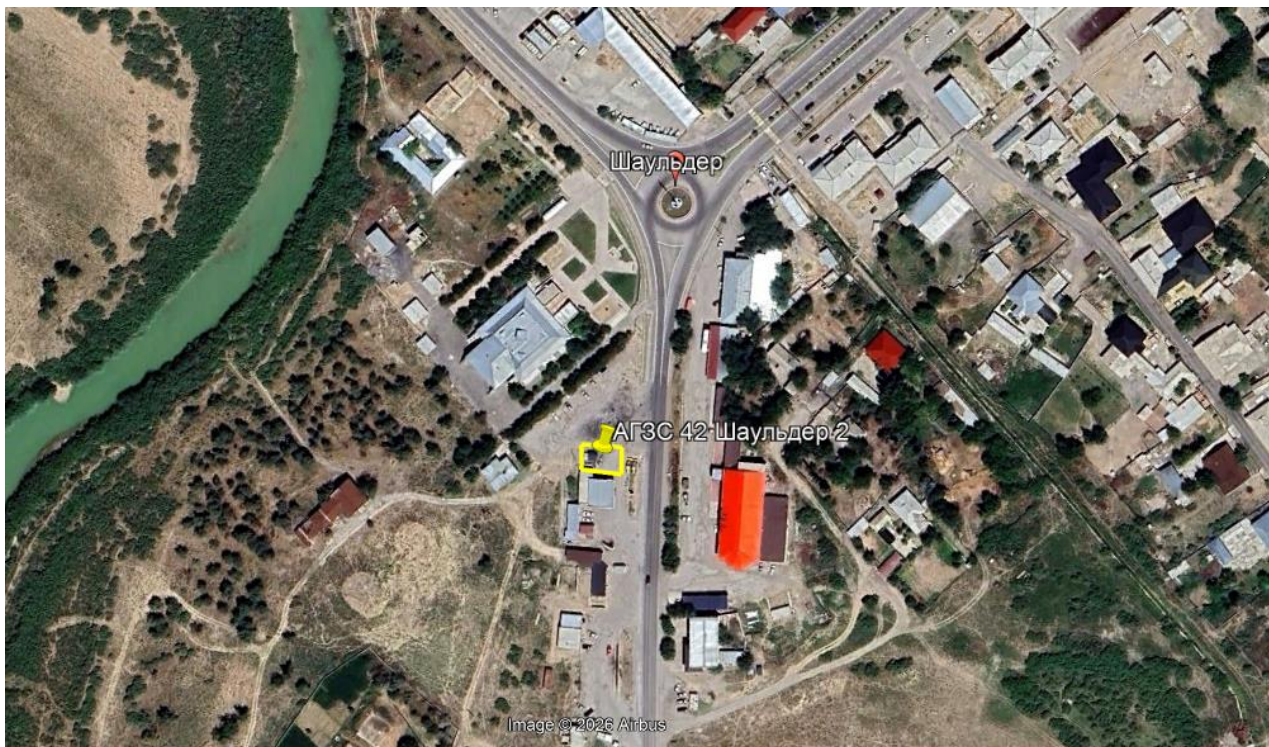
Рис.1. Ситуационная карта-схема проектируемого участка

Водоохранная зона и прибрежная защитная полоса реки Арысь проектируемым объектом не нарушаются.