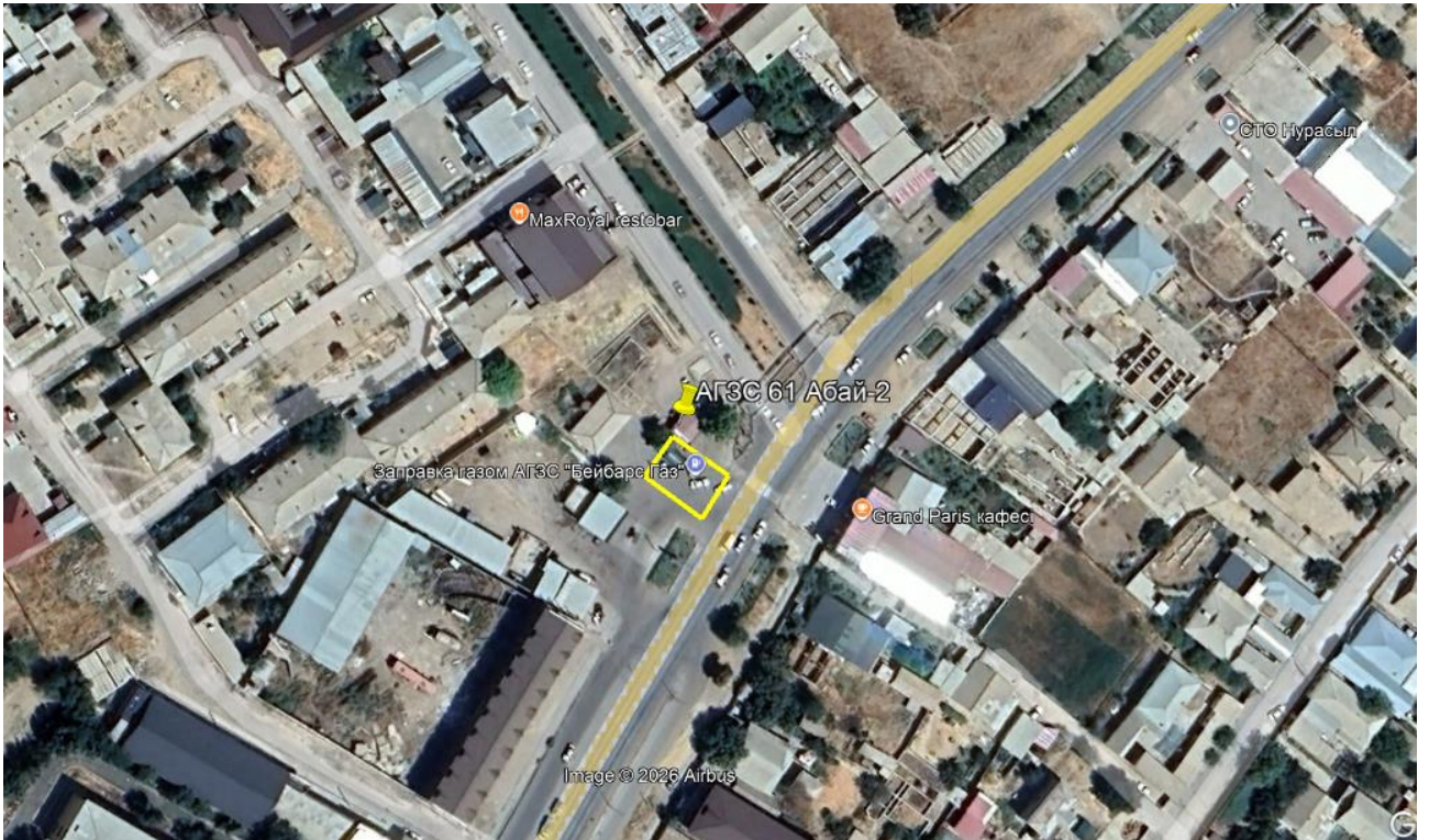
Рис.1. Ситуационная карта-схема проектируемого участка