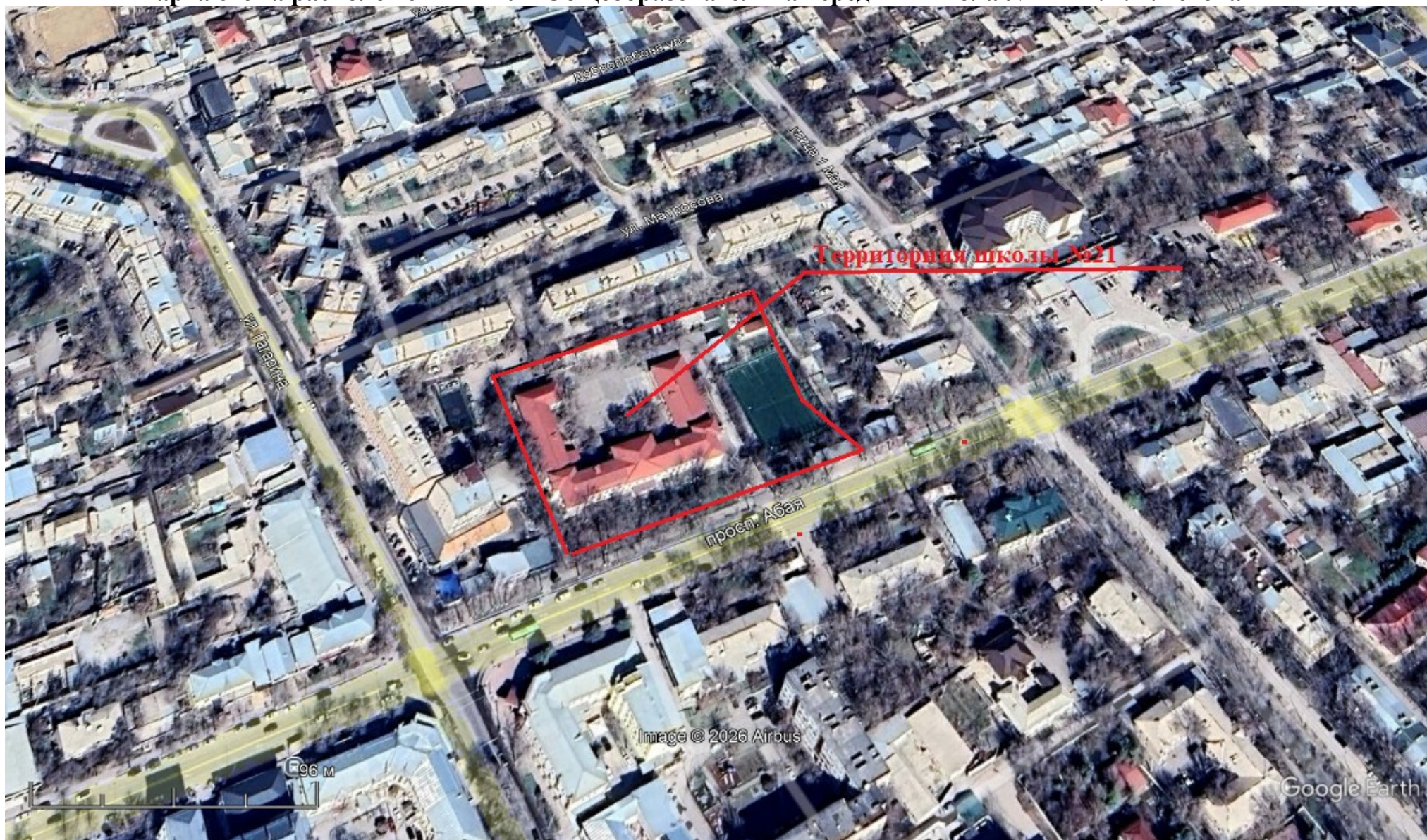
Карта схема расположения КГУ «Общеобразовательная средняя школа №21 им.А.П.Чехова»