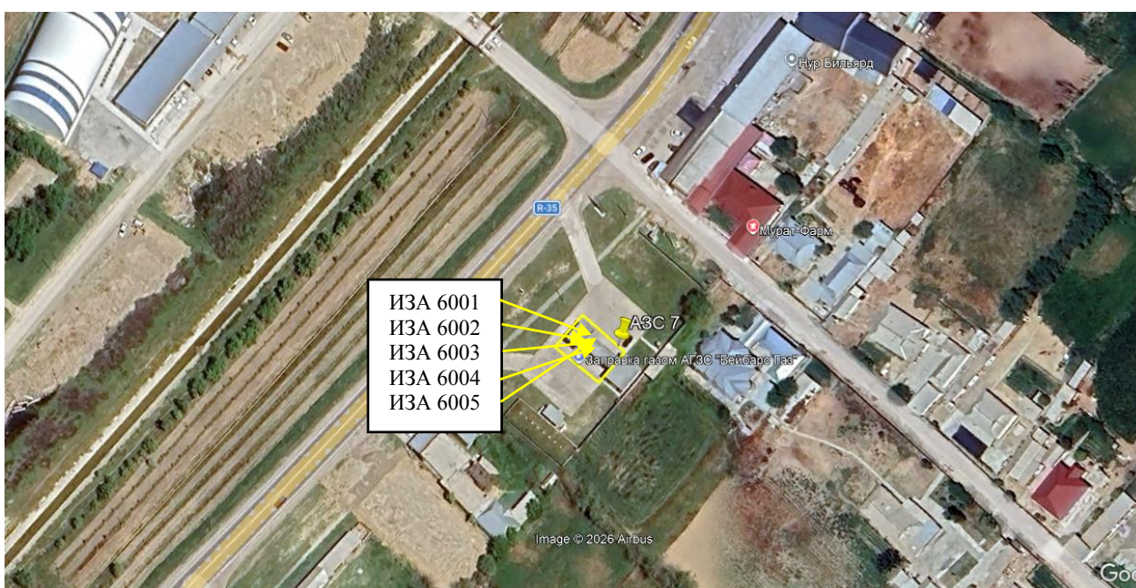
Рис. 1.1. Карта-схема объекта с нанесенными на нее источниками выбросов загрязняющих веществ в атмосферу