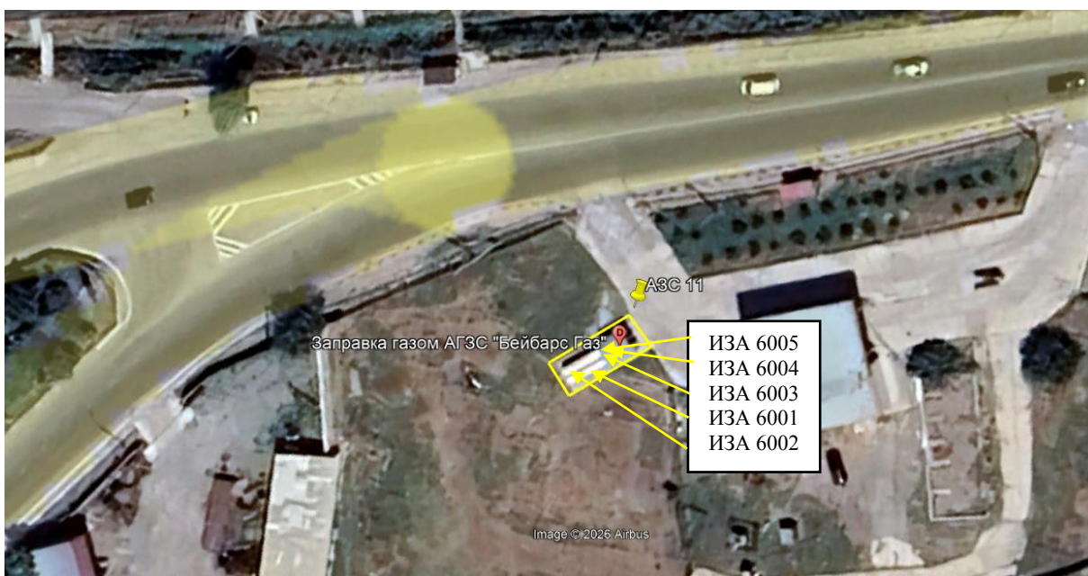
Рис. 1.1. Карта-схема объекта с нанесенными на нее источниками выбросов загрязняющих веществ в атмосферу