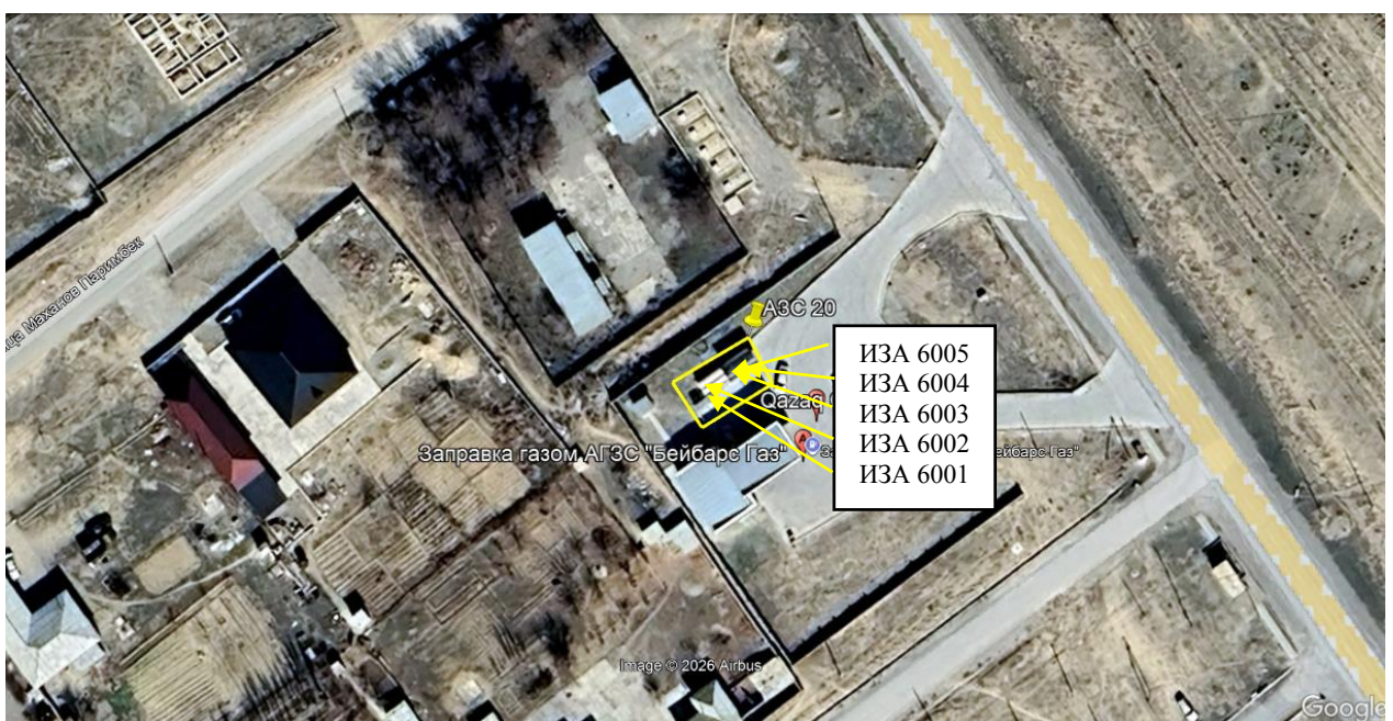
Рис. 1.1. Карта-схема объекта с нанесенными на нее источниками выбросов загрязняющих веществ в атмосферу