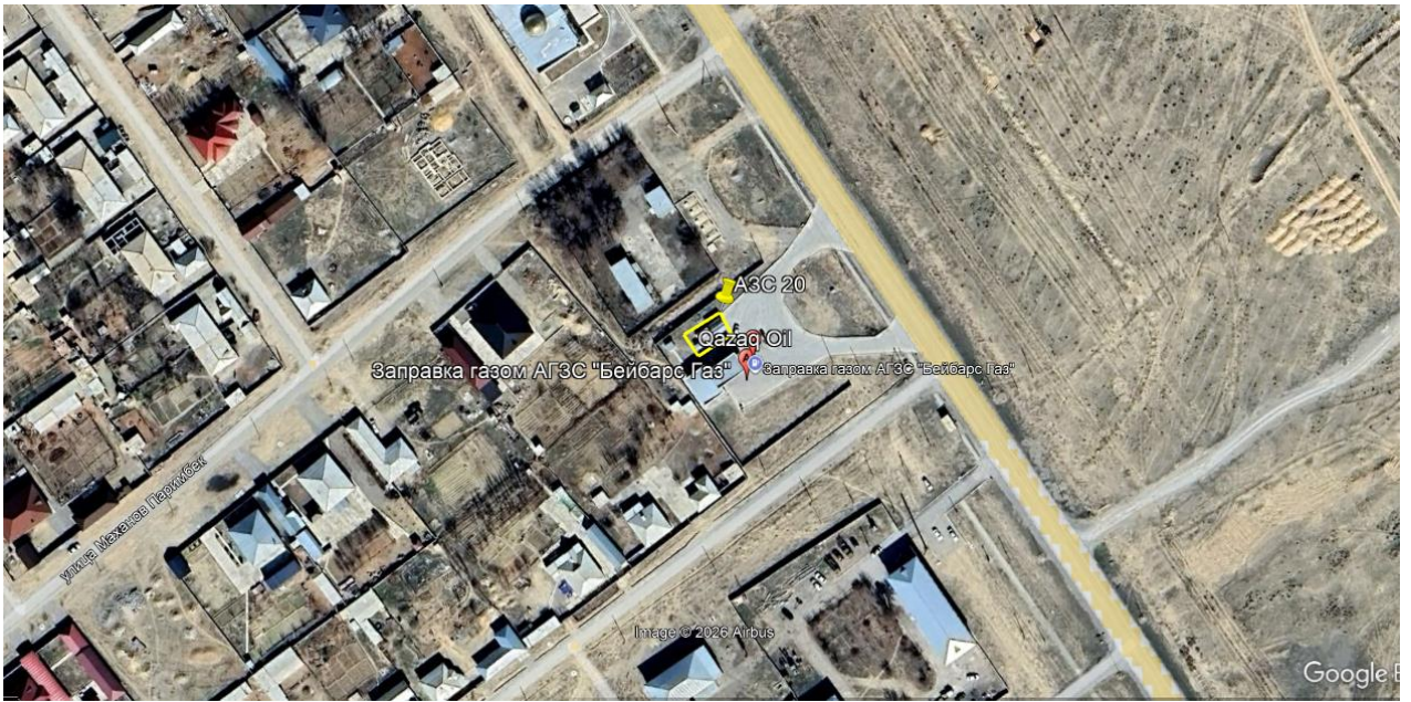
Рис.1. Ситуационная карта-схема проектируемого участка