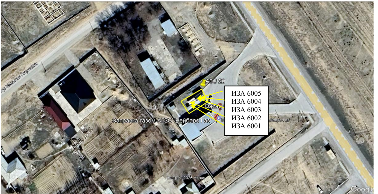
Рис. 1.1. Карта-схема объекта с нанесенными на нее источниками выбросов загрязняющих веществ в атмосферу