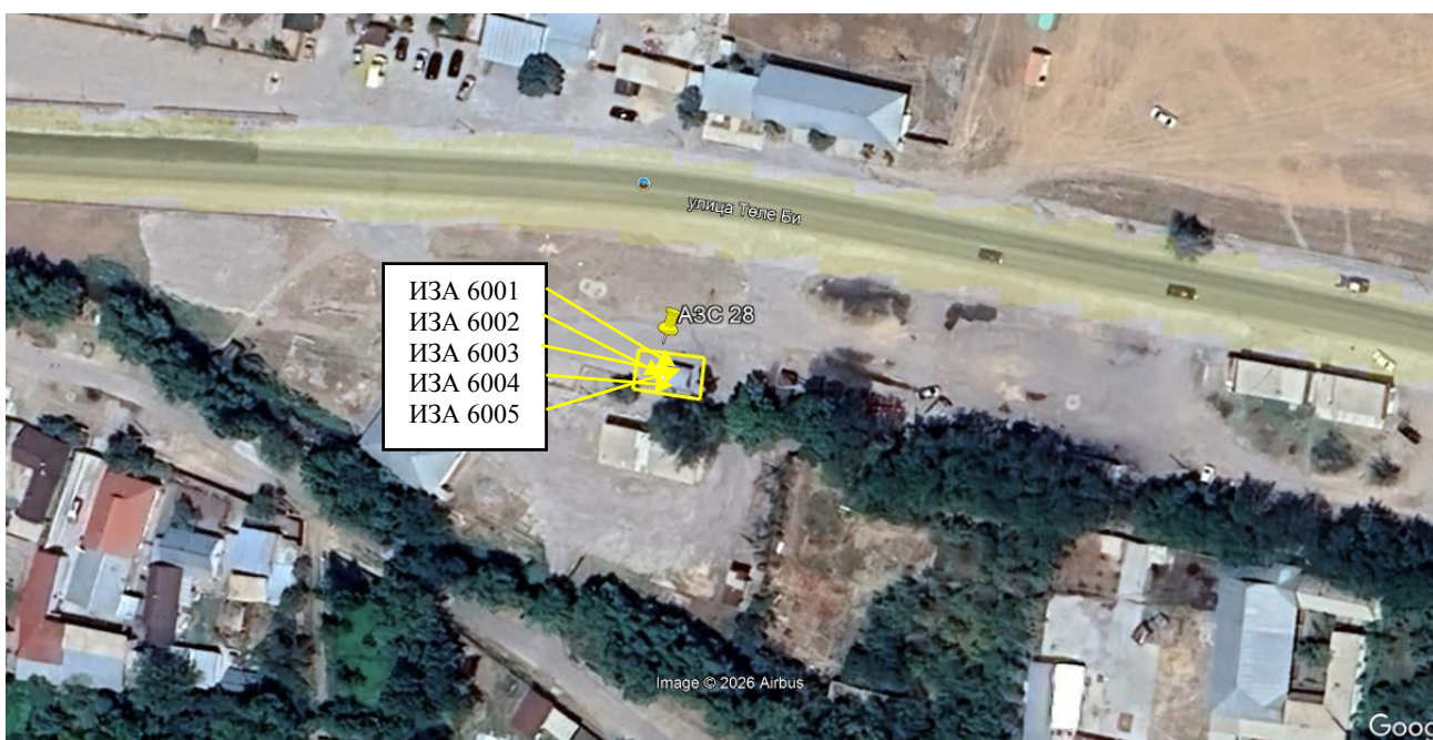
Рис. 1.1. Карта-схема объекта с нанесенными на нее источниками выбросов загрязняющих веществ в атмосферу