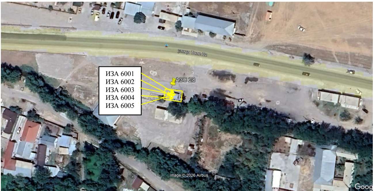
Рис. 1.1. Карта-схема объекта с нанесенными на нее источниками выбросов загрязняющих веществ в атмосферу