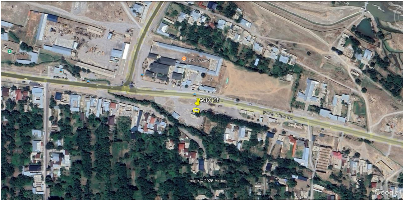
Рис.1. Ситуационная карта-схема проектируемого участка