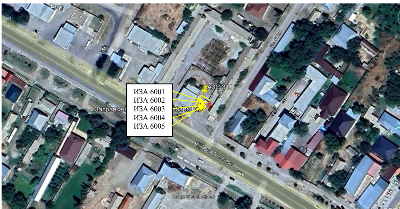
Рис. 1.1. Карта-схема объекта с нанесенными на нее источниками выбросов загрязняющих веществ в атмосферу