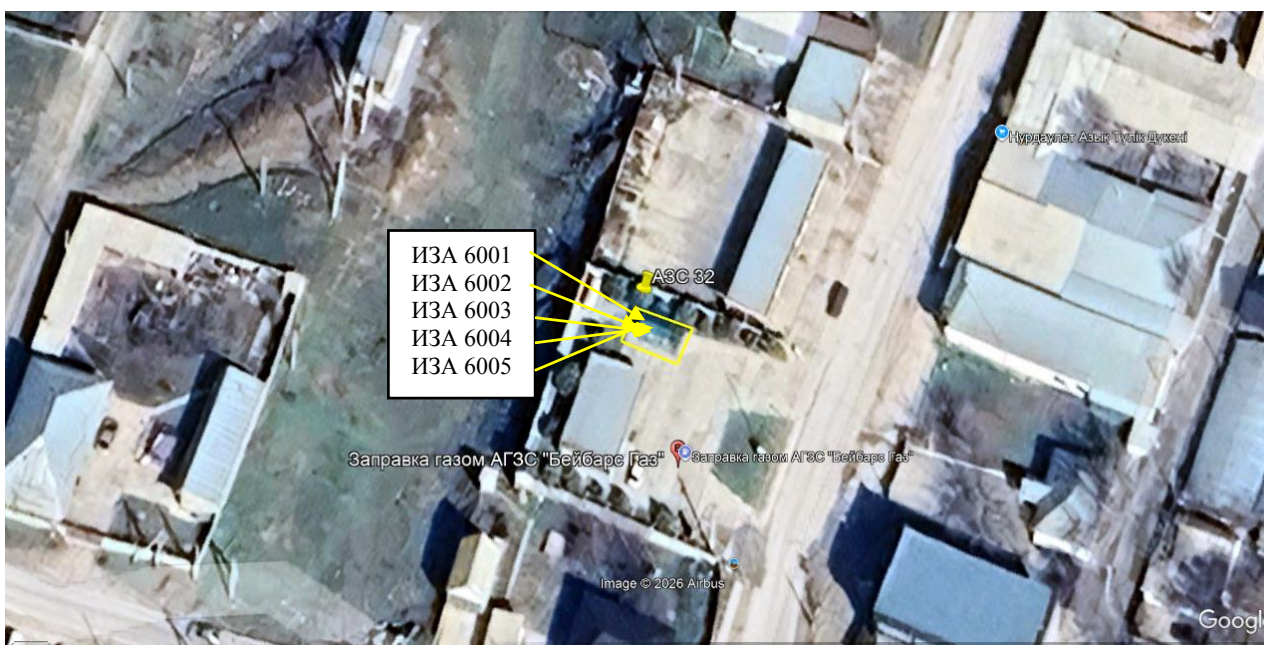
Рис. 1.1. Карта-схема объекта с нанесенными на нее источниками выбросов загрязняющих веществ в атмосферу