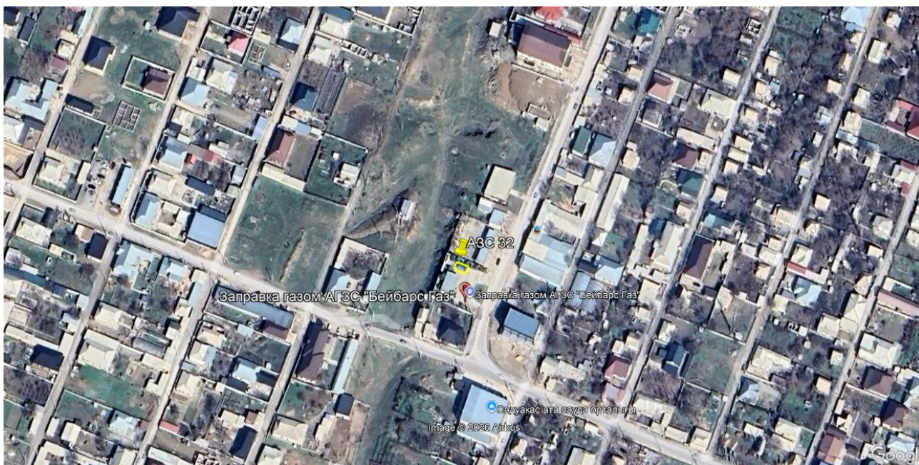
Рис.1. Ситуационная карта-схема проектируемого участка