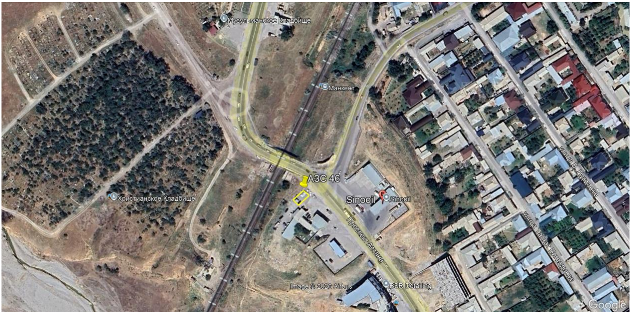
Рис.1. Ситуационная карта-схема проектируемого участка