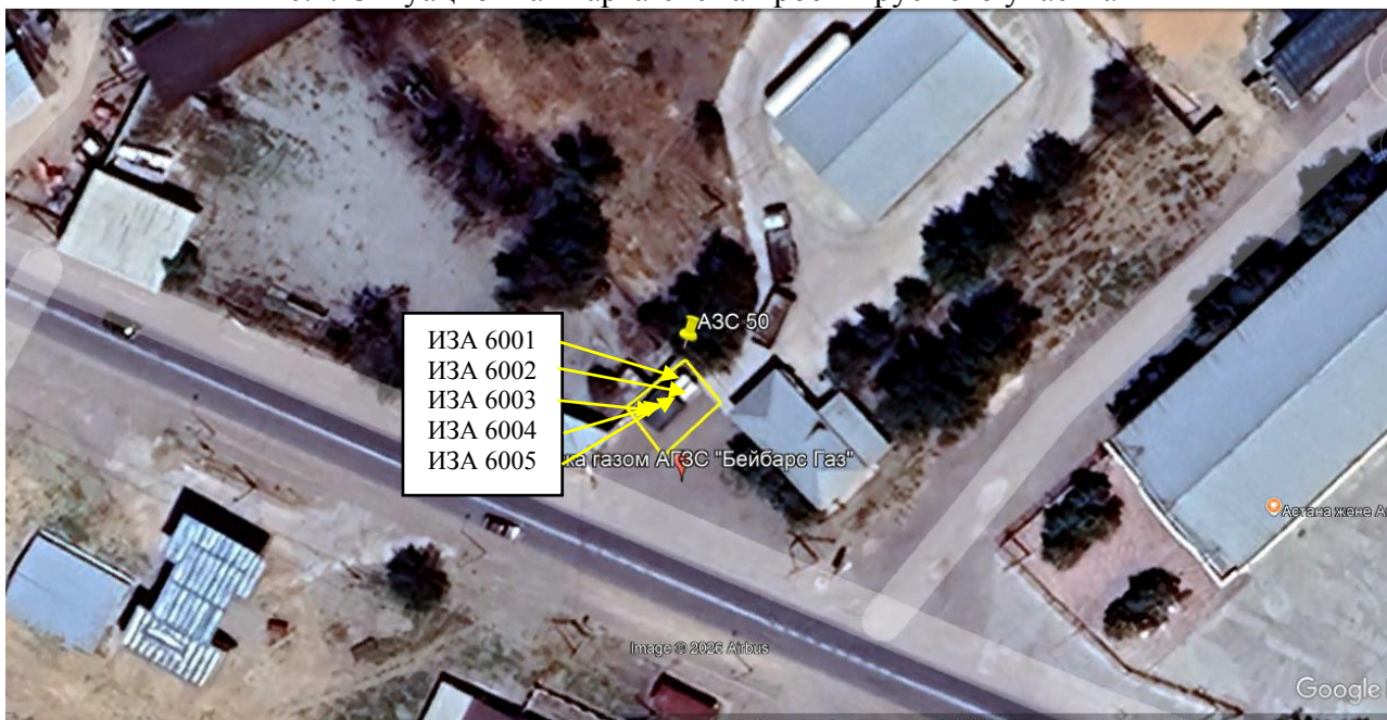
Рис. 1.1. Карта-схема объекта с нанесенными на нее источниками выбросов загрязняющих веществ в атмосферу