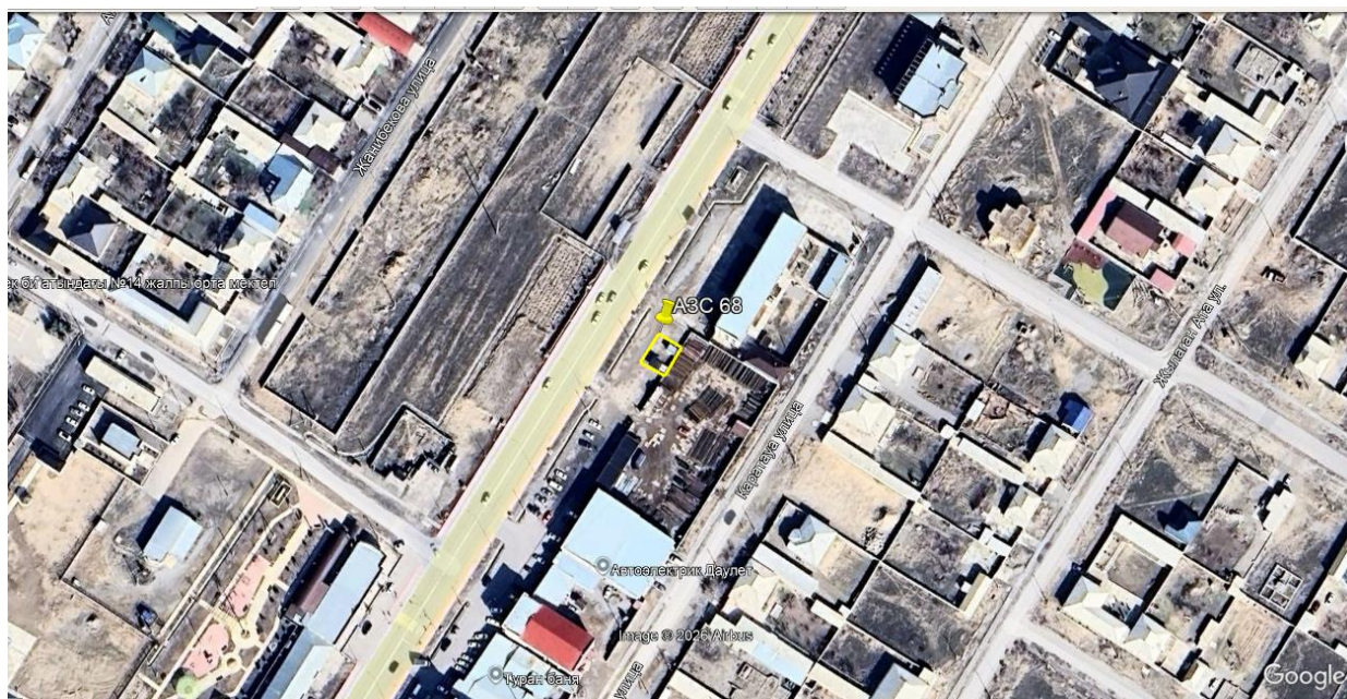
Рис.1. Ситуационная карта-схема проектируемого участка

промышленной безопасности и системы контроля загазованности. Открытых поверхностных водоемов в зоне прямого влияния объекта не обнаружено. Существующая дорожная инфраструктура обеспечивает удобный подвоз топлива без заезда в жилые кварталы.