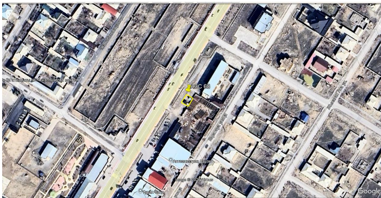
Рис.1. Ситуационная карта-схема проектируемого участка