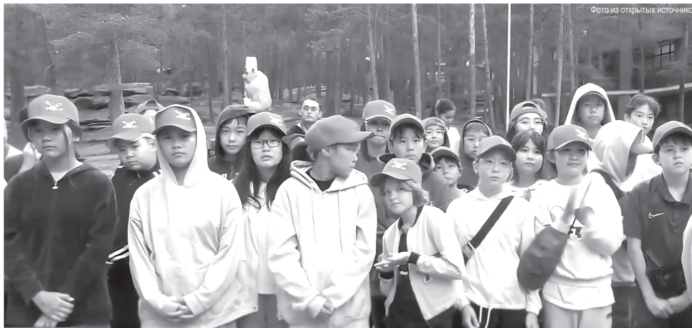
фото из открытых источников.