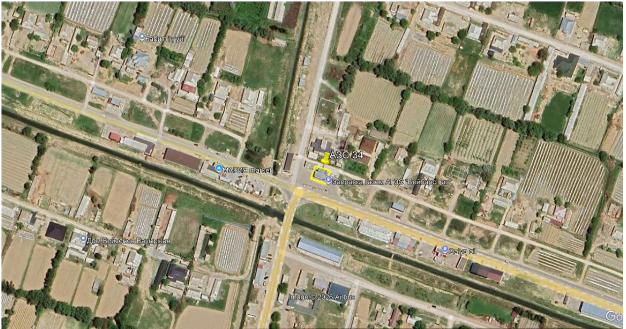
Рис.1. Ситуационная карта-схема проектируемого участка