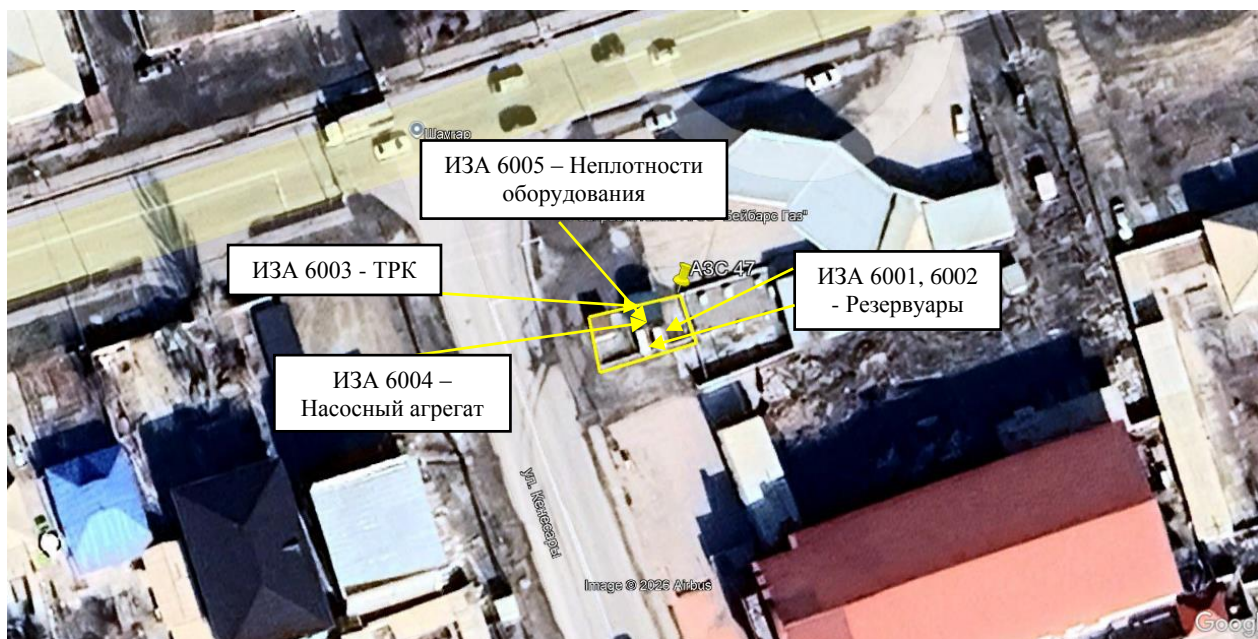
Рис. 1.1. Карта-схема объекта с нанесенными на нее источниками выбросов загрязняющих веществ в атмосферу