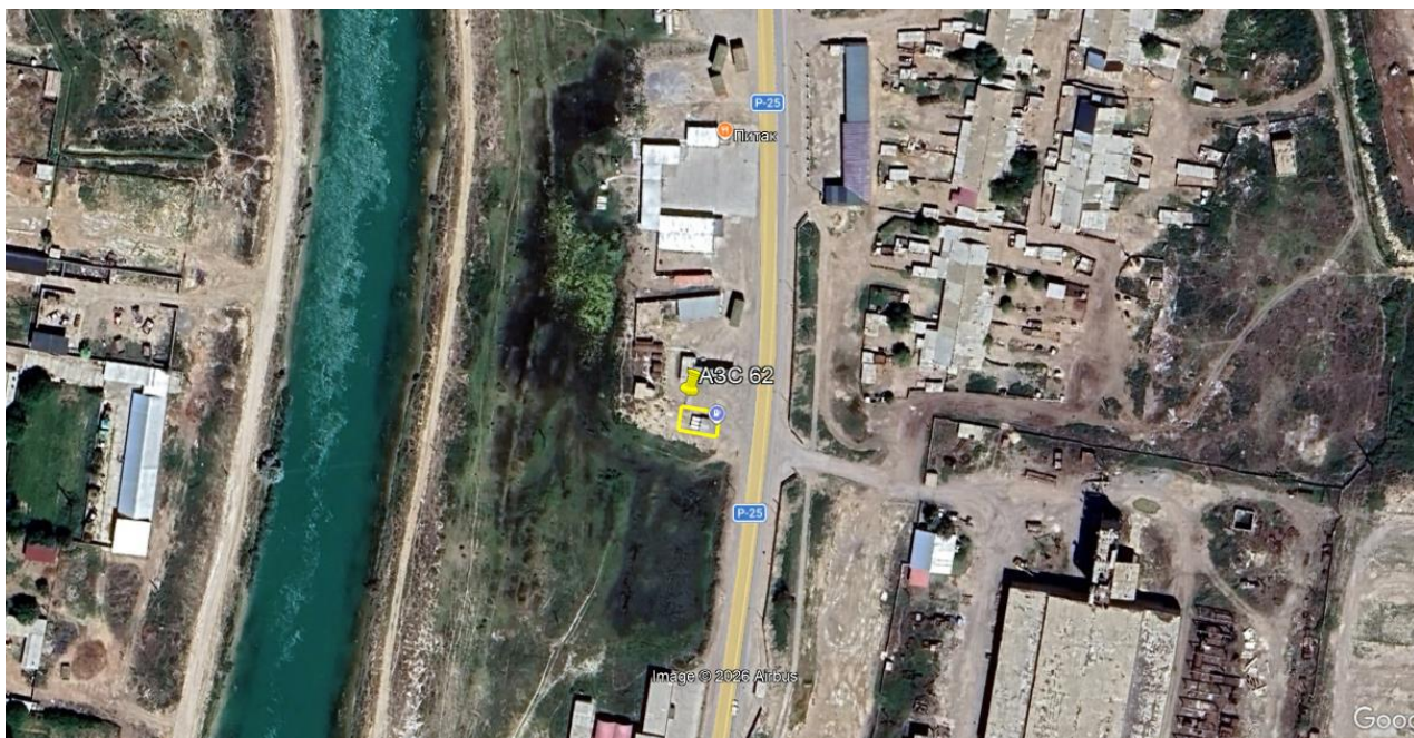
Рис.1. Ситуационная карта-схема проектируемого участка

Рельеф района расположения площадки равнинный, имеет общий уклон в сторону русла реки на западе. Поверхность территории АГЗС №62 полностью обустроена сплошным твердым водонепроницаемым покрытием (асфальтобетон), локализованным по периметру бордюрным камнем, что исключает инфильтрацию технологических проливов нефтепродуктов или сжиженного газа в почвенную толщу и сопредельные грунтовые воды.