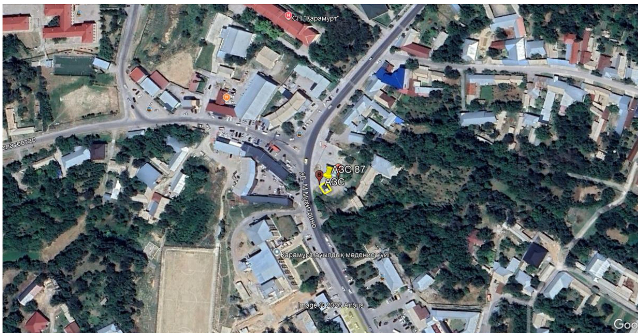
Рис.1. Ситуационная карта-схема проектируемого участка

Рельеф района расположения площадки равнинный, со слабовыраженным местным уклоном, антропогенно измененный. Вся операционная и проезжая территория АГЗС №87 имеет сплошное твердое водонепроницаемое покрытие (асфальтобетон/бетон), изолирующее почвенно-растительный слой и полностью исключаящее риски инфильтрации технологических проливов нефтепродуктов или СУГ в сопредельные грунты и подземные горизонты.