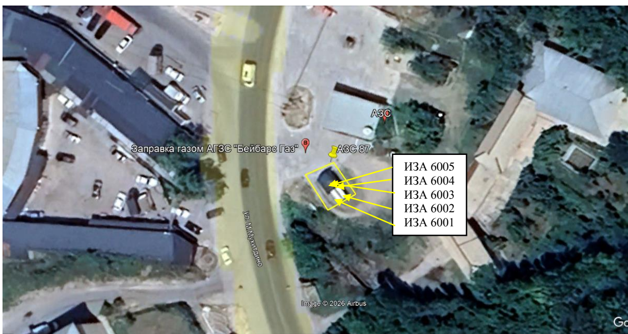
Рис. 1.1. Карта-схема объекта с нанесенными на нее источниками выбросов загрязняющих веществ в атмосферу