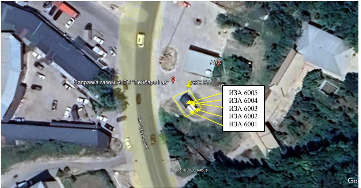
Рис. 1.1. Карта-схема объекта с нанесенными на нее источниками выбросов загрязняющих веществ в атмосферу