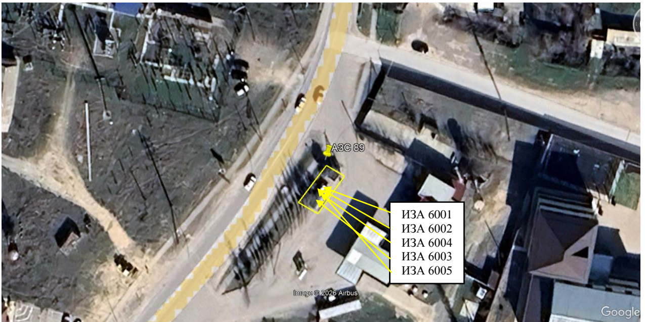
Рис. 1.1. Карта-схема объекта с нанесенными на нее источниками выбросов загрязняющих веществ в атмосферу