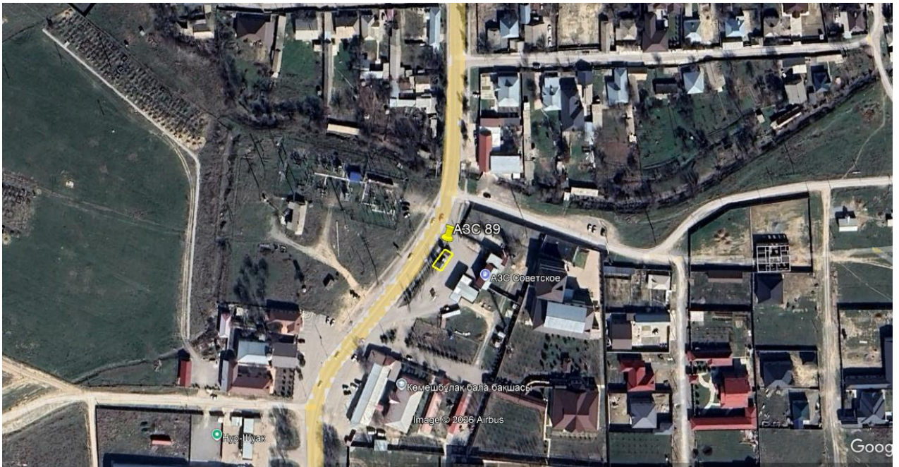
Рис.1. Ситуационная карта-схема проектируемого участка