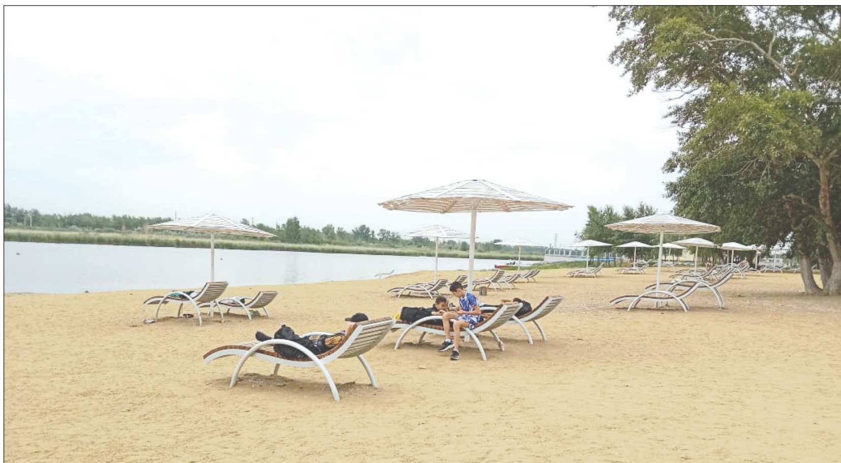
Закон не проводит черту между муниципальными и частными пляжами. Можно везде?

По статье закона, которая этим летом станет причиной множества конфликтов