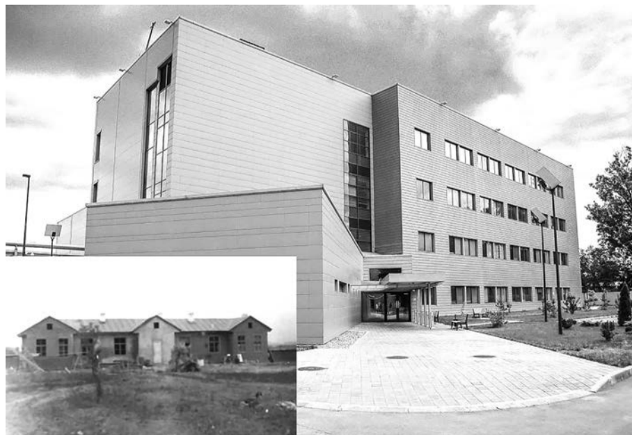
Среднеазиатский противочумный институт в прошлом и в настоящем