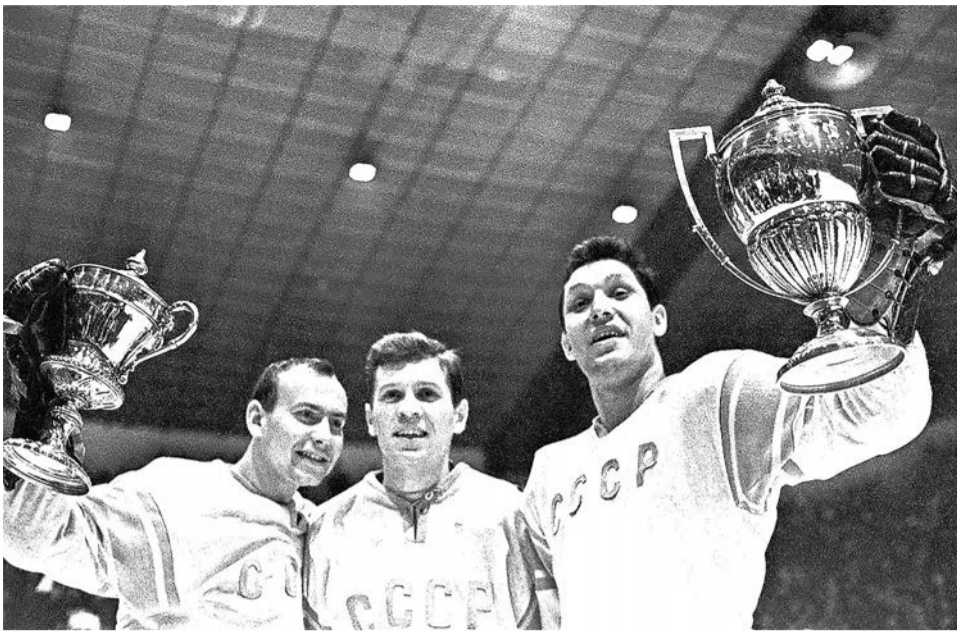
Чемпионат мира по хоккею в Тампере. 1965 год. Слева направо: Александр Альметов, Борис Майоров и Александр Рагулин с кубками чемпионов мира и Европы

в ЦСКА не слишком обращали внимания, ну не мешал он мне никогда! А тут... Объявили, что плохо готов и что на меня больше не рассчитывают. В воскресенский «Химик», который меня воспитал, не дали вернуться, в ленинградский СКА я сам не пошел.