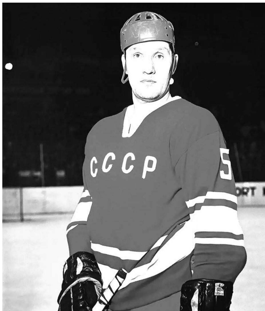
Защитник сборной СССР и ЦСКА Александр Рагулин. 1971 год

И в гулких коридорах военного госпиталя, и в рабочем кабинете, и в домашней обстановке в комнате, опасно напоминав-