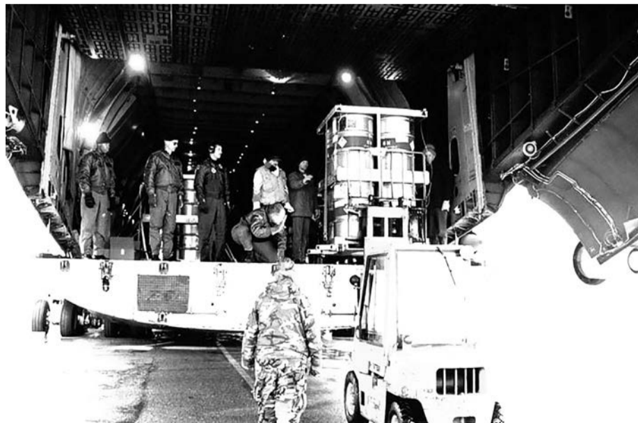
Операция «Сапфир». Погрузка урана в самолет