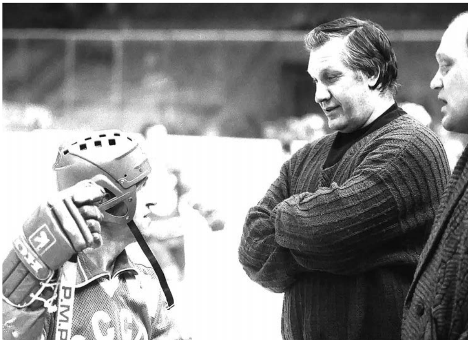
Москва. 19 декабря 1990 года. Хоккейный турнир на приз газеты «Известия». Борис Михайлов, Александр Рагулин, Владимир Петров

— Рановато закончил, скрывать не буду. Не сам — «закруглил» меня Анатолий Владимирович Тарасов, так в 32 года все и завершилось. Нынче вон нападающие до сорока лет играют, не говоря уже о защитниках. Тогда, правда, редко кто до 33-х в большом хоккее доживал. Я-то вполне мог еще три-четыре года погоды не портить — но раз «сам» решил от меня избавиться, то это уже ничем прошибить было нельзя. Самое обидное, что из сборной не выгоняли — принявший сборную после Саппоро Всеволод Михайлович Бобров ко мне очень хорошо относился. Весной 72-го в третий раз стал олимпийским чемпионом, осенью участвовал в исторической суперсерии СССР — Канада и только два матча пропустил (в том числе и последний, кстати). Весной 73-го чемпионат мира проходил в Москве, мы выиграли его с фантастическим стопроцентным результатом (кажется, сто шайб за турнир забросили) и вернули себе звание чемпионов. Никаких претензий по игре ко мне не было, не за былые заслуги меня в сборной держали, не без моей помощи в люди вышли и Гена Цыганков, и Володя Лутченко, и Сашка Гусев. С лишним весом — да, проблемы имелись, но до лета 73-го как-то на них