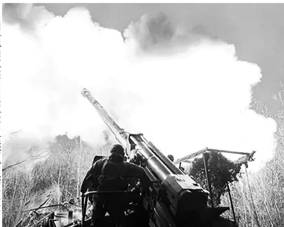
Артиллерист ВС РФ стреляет из пушки «Гиацинт-Б» в Белгородской области, 18 марта 2026 года

« В 82-Й ПЕХОТНЫЙ ПОЛК СТРАШНО БЫЛО ПОПАСТЬ. У НАС ВСЕ О НЕМ ТАК ГОВОРИЛИ КАК О МЕСТЕ, КУДА ССЫЛАЮТ ТИПА В НАКАЗАНИЕ. НЕ ВЫПОЛНЯЕШЬ ПРИКАЗЫ, НЕ СЛУШАЕШЬСЯ — ТЕБЕ ГОВОРЯТ: «СМОТРИ, ПОЕДЕШЬ В 82-Й ПОЛК, НА ВОЛЧАНСК!» ВОТ Я ТУДА И ПОПАЛ