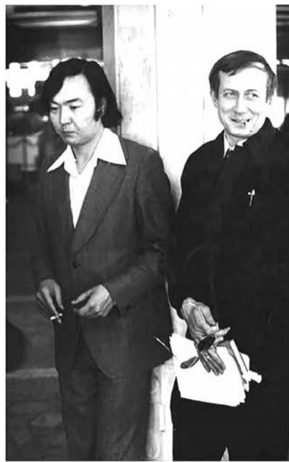
С. Е. Евтушенко, Р. Рождественским, А. Вознесенским

«Враги наши купят свечку и вставят ее в зоб себе. Мы живы, Олжас! Мы вечно будем в седле...»