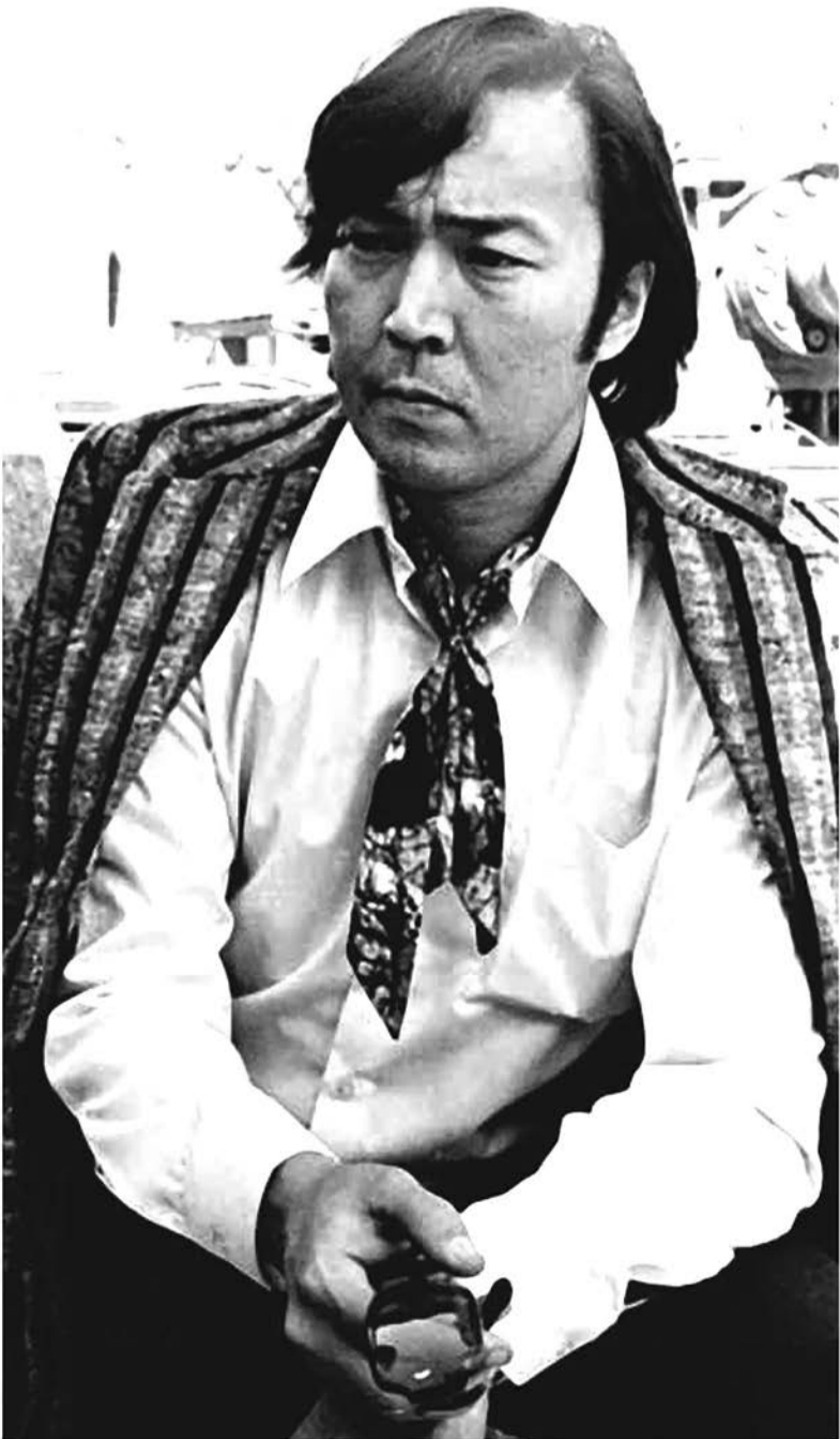
Олжас Сулейменов фото из книги «Я знаю»

Вообще Сулейменов — человек космический. Его поэма «Земля поклонись человеку», облетевшая планету, вслед за первым человеком, отправившимся к звёздам, подружила Олжеке и Юрия Гагарина. Как-то, у меня дома, Сулейменов увидел газету «Социалистік Қазақстан» от 12 апреля 1962 года, где на первой странице