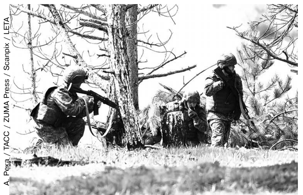
Военнослужащие РФ во время подготовки штурмовой пехоты в Луганской области, Украина, 16 апреля 2026 года