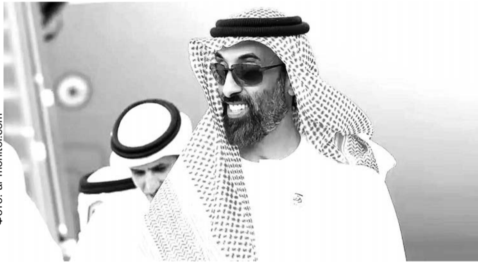
Тахнун бен Зайд

Однако на длинной дистанции распад координации бьет по всем производителям — из-за высокой волатильности и риска па-