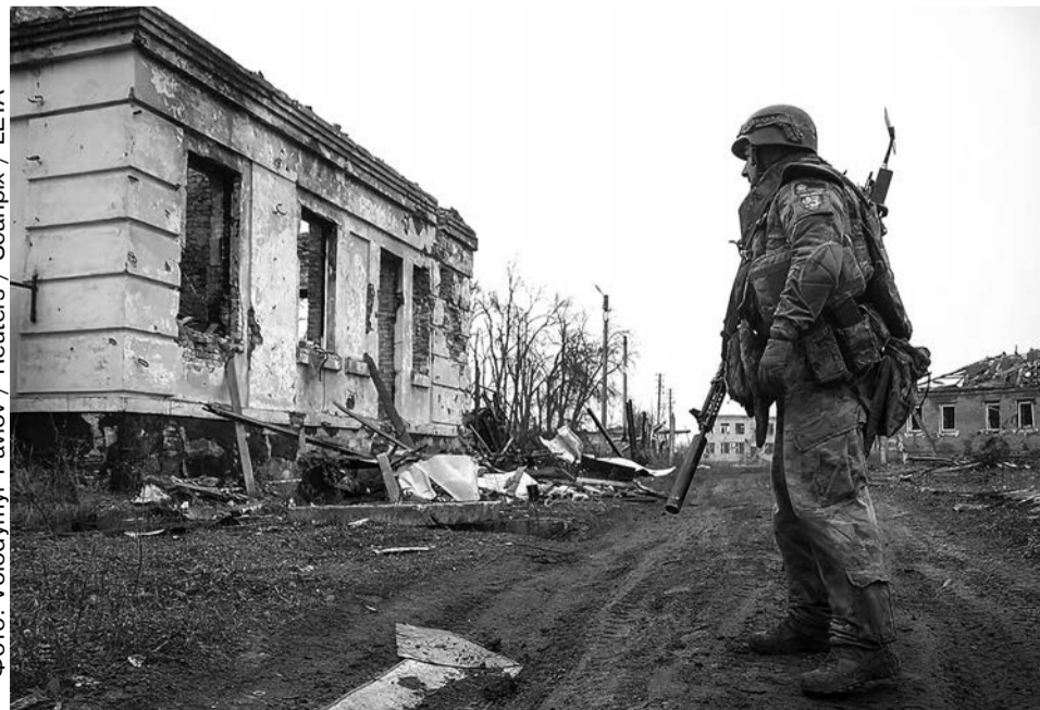
Военнослужащий Национальной гвардии Украины в прифронтовом Харьковской области, 27 января 2025 года

— Да нет, мы просто сидели в эти последние недели в подвале, там не до умывания было. Страшно настолько, что капел! Ну и всё — они подожгли дом, и, когда подвал начал заполняться дымом, мы начали понимать, что всё: или задохнемся, или надо сдаваться. Мы покричали вроде, что сдаемся, а нам никто не ответил: видимо, ушли они просто.