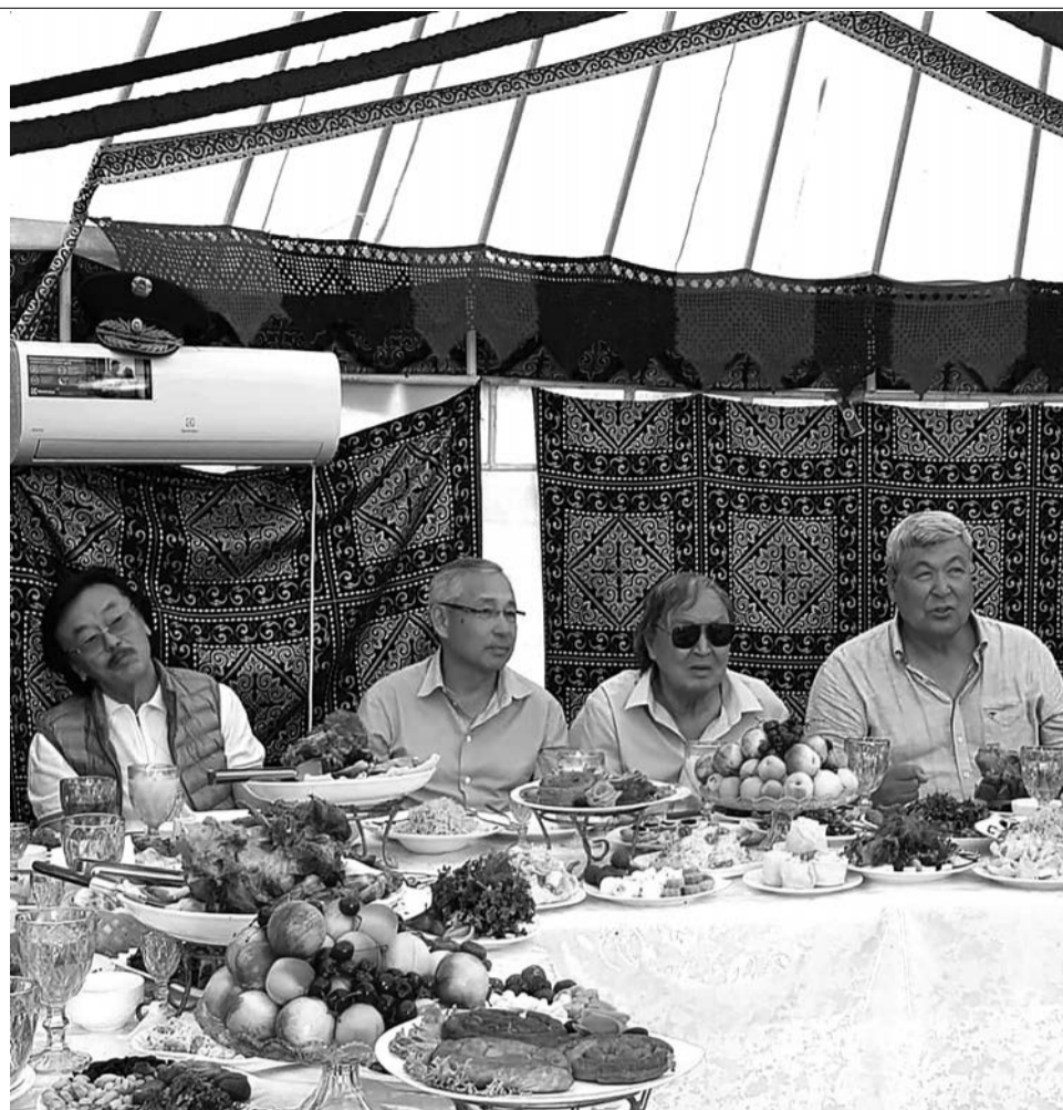
Секен Турысбек, Узакбай Айтжанов, Олжас Сулейменов, Тохтар Аубакиров

О знакомстве с Евгением Евтушенко Олжасе вспоминал так.: «Он первый проявил себя на поэтических подмостках во время оттепели. Для всех нас он был учителем, так как многое привнес своим появлением в советскую культуру. Помню, я приехал в 1969 году в Москву, и он позвонил мне в отель, пригласил меня позавтракать к себе домой. Я приехал и увидел у него на столике мое произведение — «Глиняную