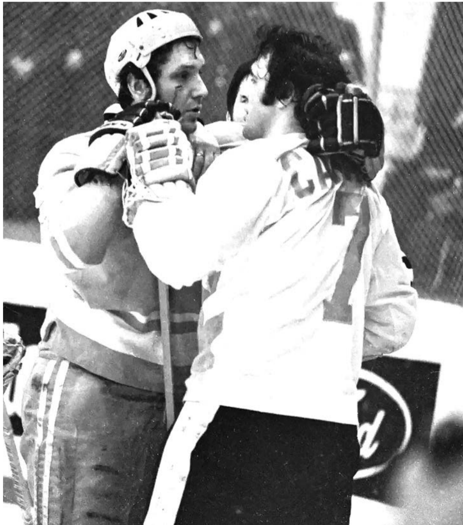
Суперсерия игр по хоккею СССР — Канада. Сентябрь 1972 года. Москва. Александр Рагулин и канадский центральный нападающий Фил Эспозито

Зла на него не держу — он был человеком своего времени. Хоккей двинул вперед очень сильно — и наш, и мировой. Творил, экспериментировал, искал. Да, никого не жалел, шел по костям и трупам, но высот советский хоккей достиг небывалых, это факт неоспоримый.