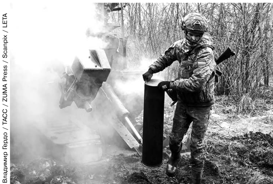
Военнослужащий ВС РФ у пушки «Гиацинт-Б» в Белгородской области, 18 марта 2026 года

— Много денег вам за контракт в итоге дали?