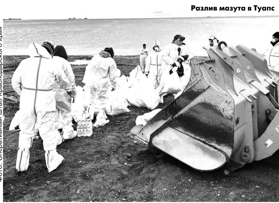
Разлив мазута в Туапсе