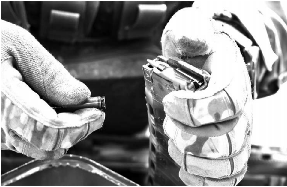
Военнослужащий десантно-штурмового батальона ВС РФ снаряжает магазин к автомату АК-12К в Запорожской области, Украина, 16 июня 2025 года