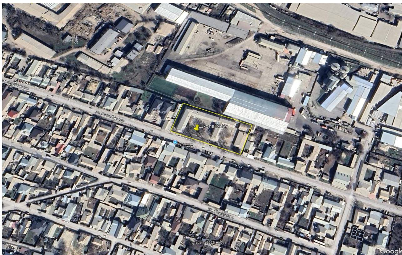
Рис. 1. Карта расположения предприятия, расположенное по адресу: г. Шымкент, К.Цеткина №89.

Карта расположения предприятия представлена на рис.1.