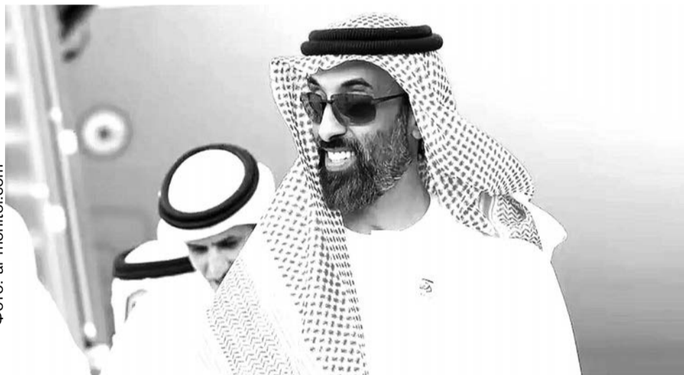
Тахнун бен Зайд

Однако на длинной дистанции распад координации бьет по всем производителям — из-за высокой волатильности и риска па-