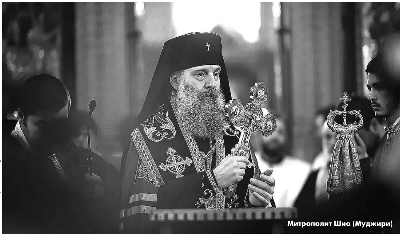
Митрополит Шιο (Муджири)