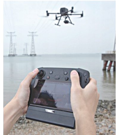
Дрон жүйесі іске қосылды