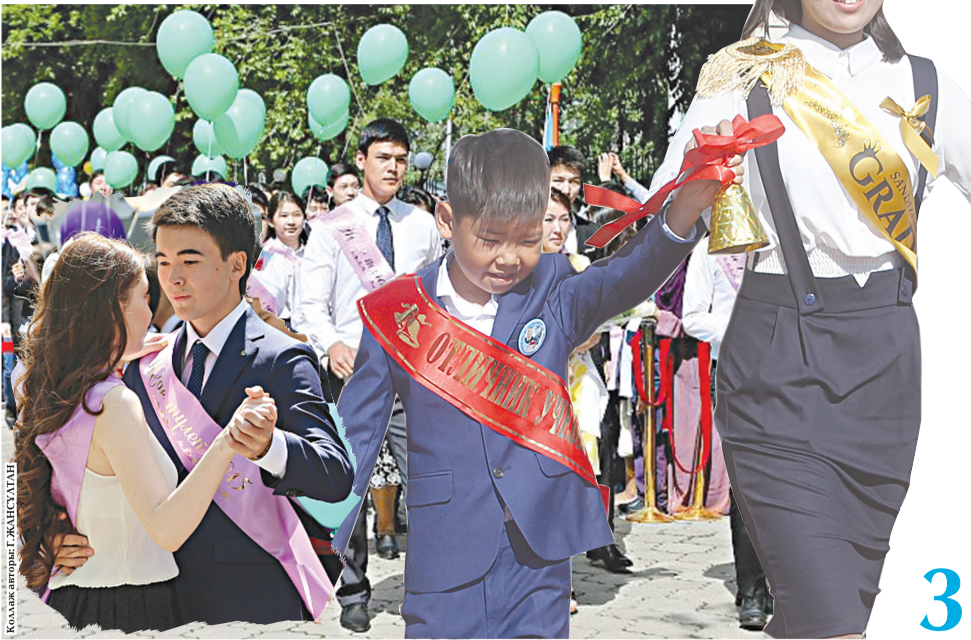
Коллаж авторы: Г. ЖАНСУАТАН

МІНЕ, ӘНЕ-МІНЕ ДЕГЕНШЕ ТАҒЫ БІР ОҚУ ЖЫЛЫ ДА АЯҚТАЛУҒА ЖАҚЫН. УАҚЫТТЫҢ ЖҮЙРІКТІГІ СОҢДАЙ, КЕШЕ ҒАНА МЕКТЕП ТАБАЛДЫРЫҒЫН АТТАҒАН ОҚУШЫЛАР БҮГІН БІР ЖЫЛДЫҚ БІЛІМІН ҚОРЫТЫНДЫЛАП, ЖАҢА БЕЛЕСКЕ ҚАДАМ БАСҚАЛЫ ОТЫР. 2025–2026 ОҚУ ЖЫЛЫ ДА АУДАН МЕКТЕПТЕРІ ҮШІН ЖЕТІСТІКТЕР МЕН ЖАҢАШЫЛДЫҚТАРҒА, ІЗДЕНІС ПЕН ІАГЕРІЛЕУГЕ ТОЛЫ ЖЫЛ БОЛДЫ. ОҚУШЫЛАР БІЛІМ МЕН ҒЫЛЫМДА, ӨНЕР МЕН СПОРТТА ТҮРАЛІ ДЕҢГЕЙДЕГІ БАЙҚАУЛАР МЕН ЖАРЫСТАРДА ТОП ЖАРЫП, АУДАН МЕРЕЙІН ҮСТЕМ ЕТТІ. КЕЛЕР ОҚУ ЖЫЛЫНДА ДА ЗЕРДЕЛІ, ЗЕЙІНДІ ЖАСТАРДЫҢ АЛАР АСУЫ АЗ ЕМЕС. СЕБЕБІ БҮГІНГІ ОҚУШЫ – ЕРТЕҢГІ ЕЛ ТРЕГІ. СОҢДЫҚТАН ЖАС БУЫННЫҢ САПАЛЫ БІЛІМ АЛЫП, САНАЛЫ ТӘРБИЕ КӨРУІ ҚОҒАМ ҮШІН АСА МАҢЫЗДЫ.