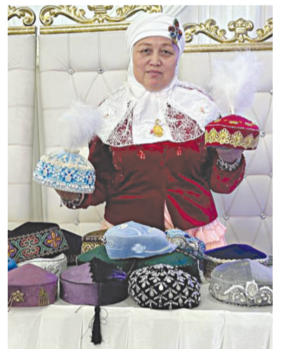
Талантты танытқан «Тақия-фест»