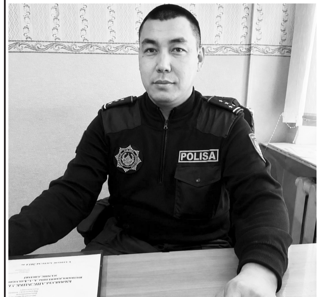
• Ко Дню Казахстанской полиции