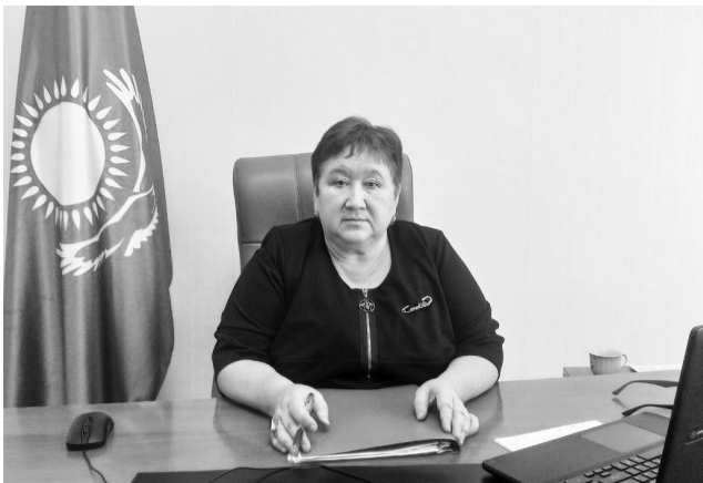
• Ко Дню государственного служащего

Трудовую деятельность начала в 1988 году директором Карасорской средней школы села Карасор Енбекшілдерского района. Молодой руководитель сразу проявила себя как грамотный организатор, ответственный и инициативный специалист, умеющий работать с людьми и добиваться поставленных целей. Ее отличали высокая требовательность к себе, стремление к постоянному