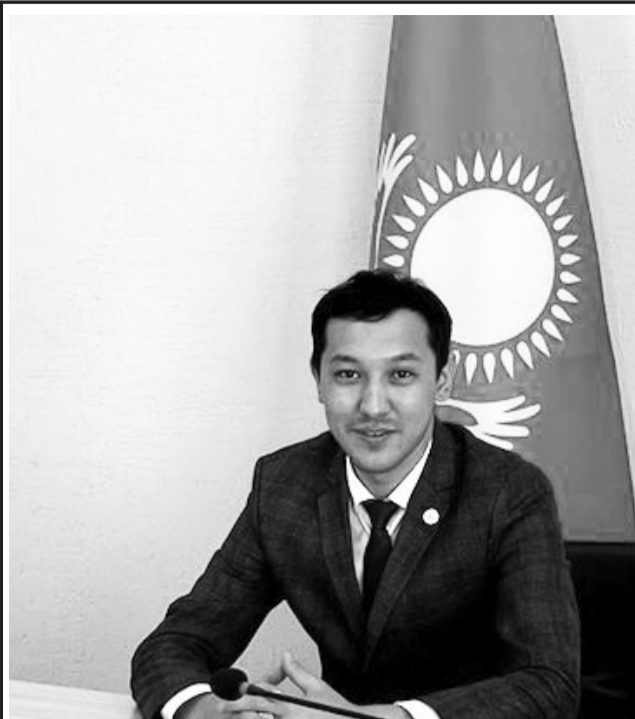
• Ко Дню государственного служащего