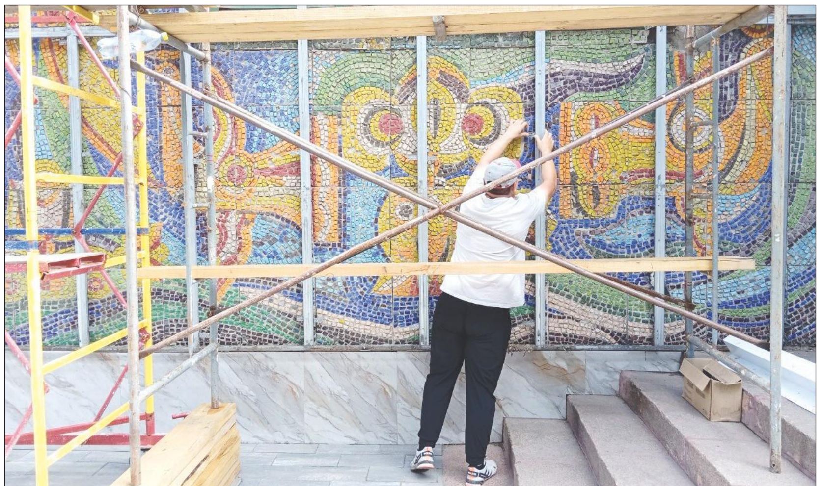
Если бы не ремонт фасада, панно в центре Костаная так и осталось только в памяти

Советская мозаика растрогала костанайцев. Сохранят ли ее после ремонта?