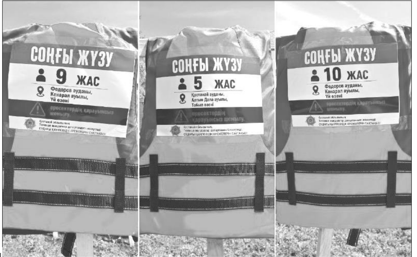
Инсталляцию представили на мероприятии «Безопасное лето - безопасная вода»

Причины смерти утонувших показали на пляже в Костанаве