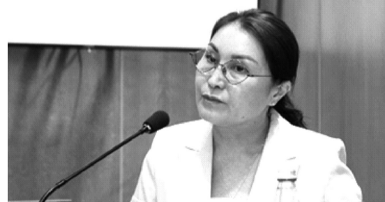
айтуынша, болашақ әйел ғалымдарды даярлаудың алғашқы кезеңі аса маңызды. Оның пікірін-