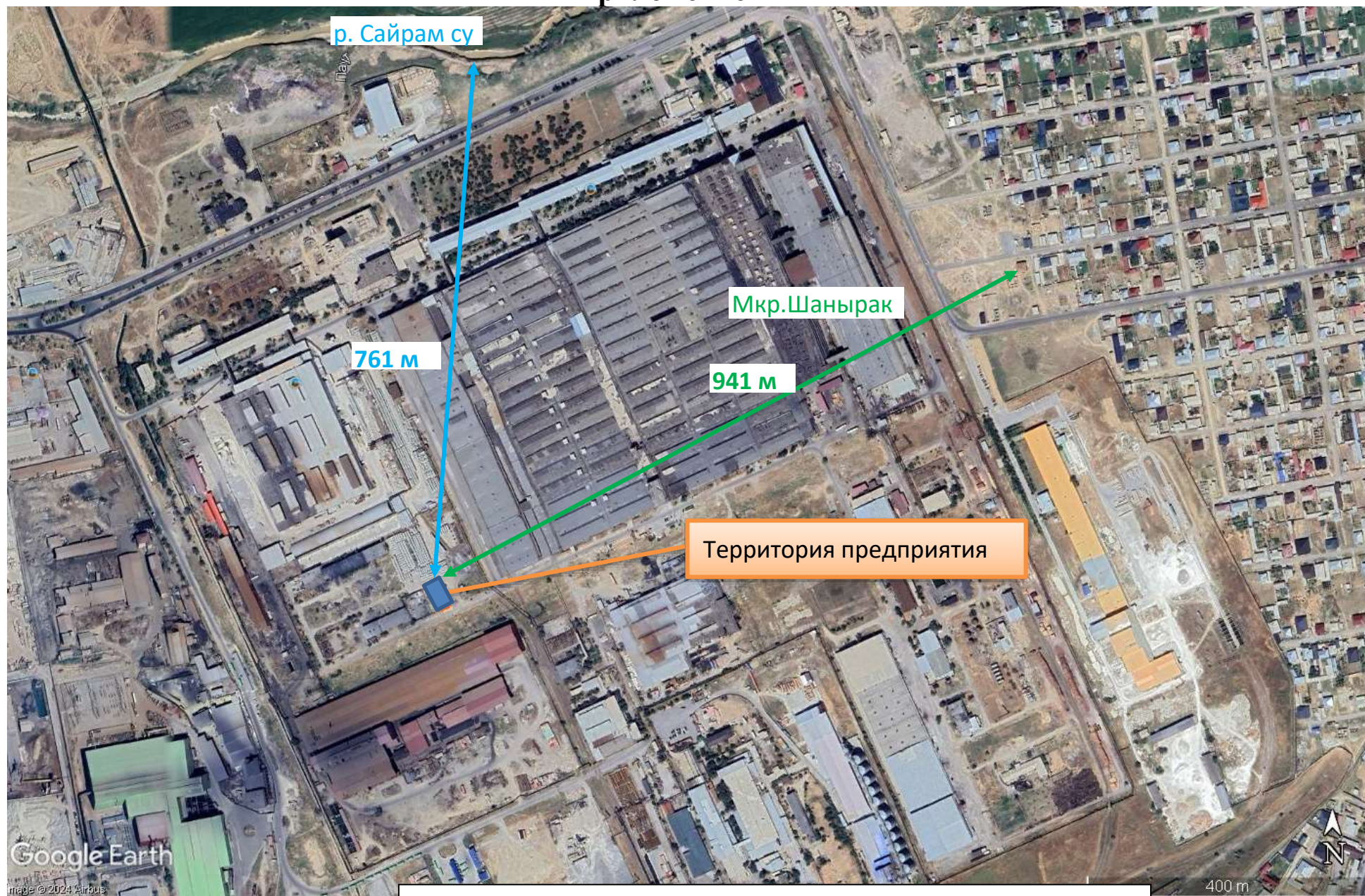
Рисунок 1.1 Обзорная карта района расположения объекта