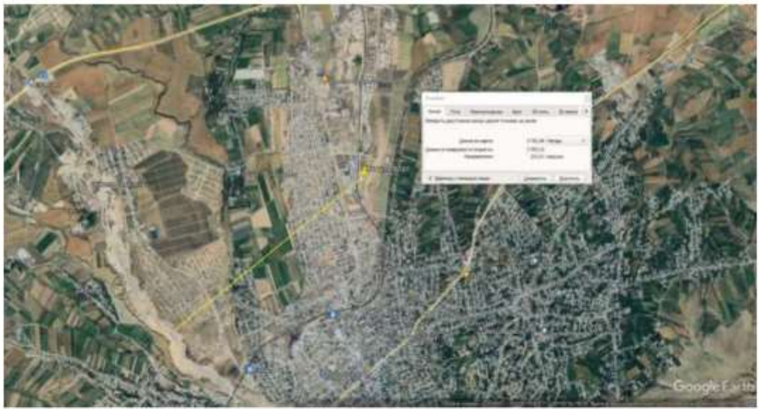
Ақсу өзеніне дейін 3,7 км қашықтық, өзеннің су қорғау аймағына кірмейді.