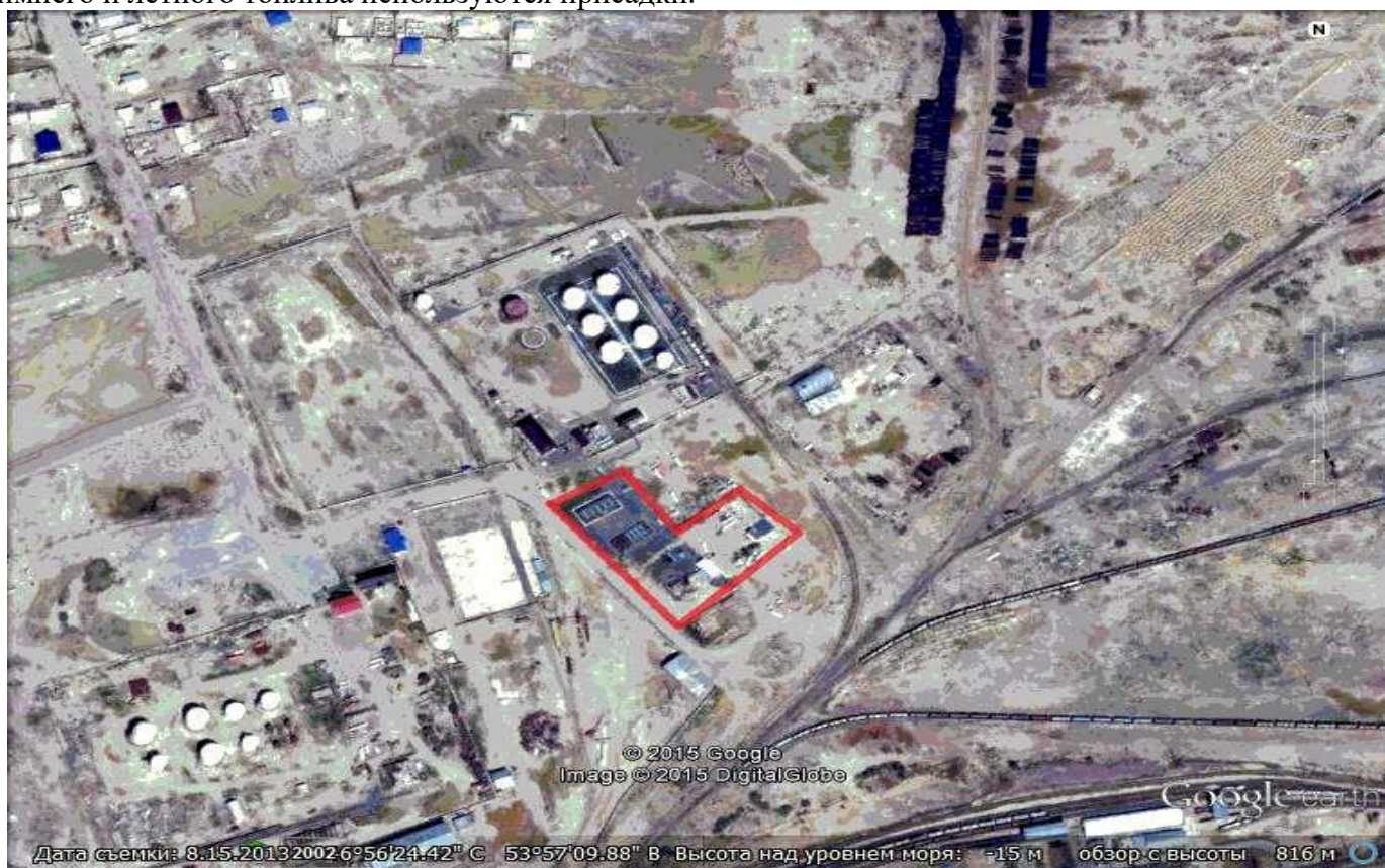
Рисунок 1.1. Карта схема расположения

Также парк готовой продукции снабжен двумя насосами перекачки, для изготовления зимнего и летнего топлива используются присадки.