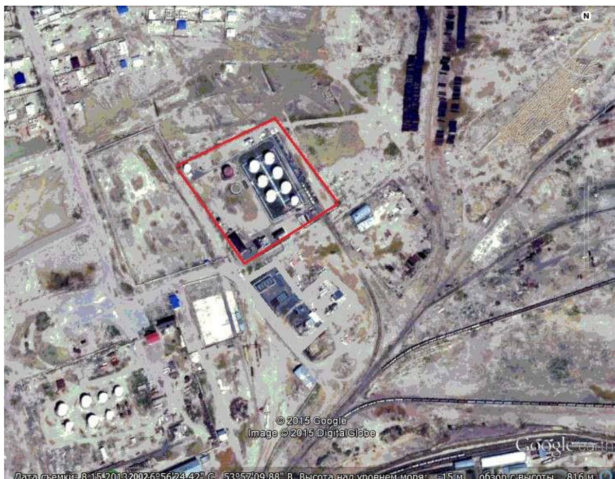
Рисунок 1.2. Карта схема расположения

Отделение нефти от пластовой воды происходит в двух отстойниках объемом 35 и 25 куб.м. Для обеспечения противопожарного запаса воды предусмотрена установка емкостей. Трубопроводы проложены наземно на низких опорах