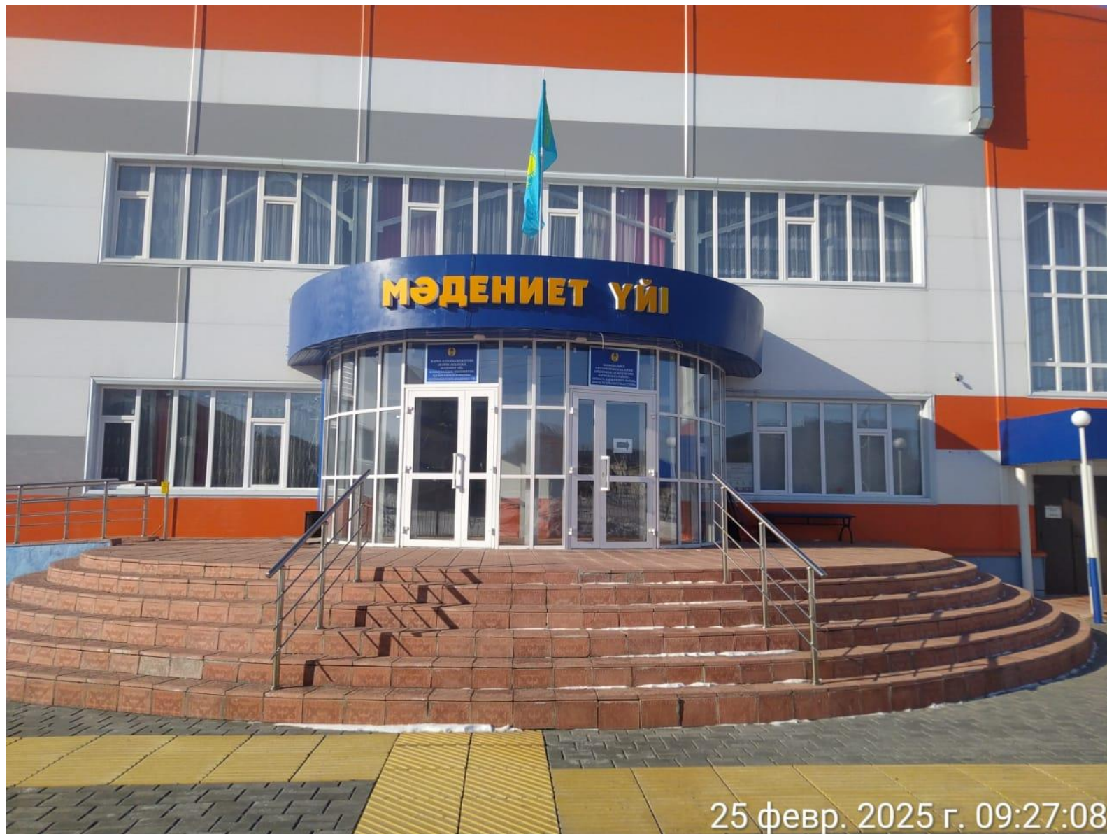
Дом культуры поселка Ауэзов Жарминского района, области Абай