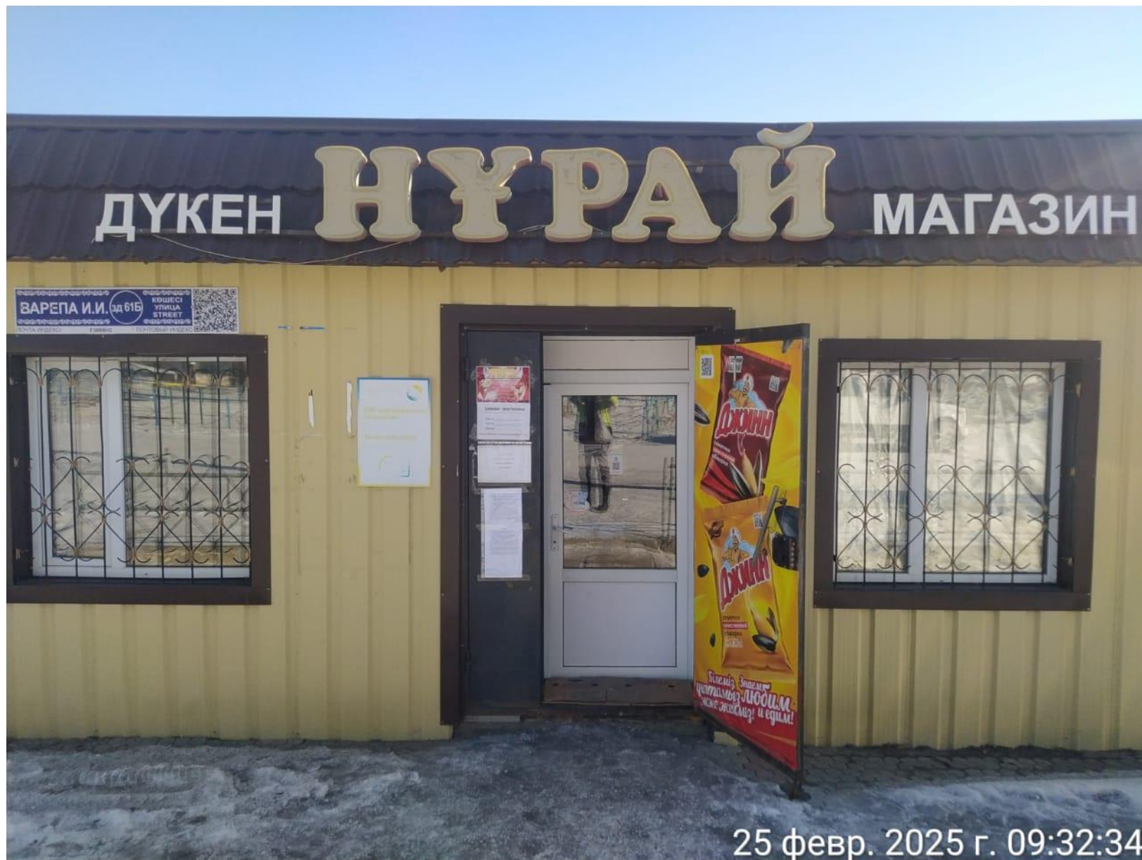
Магазин «НУРАЙ» Ауэзов Жарминского района, области Абай