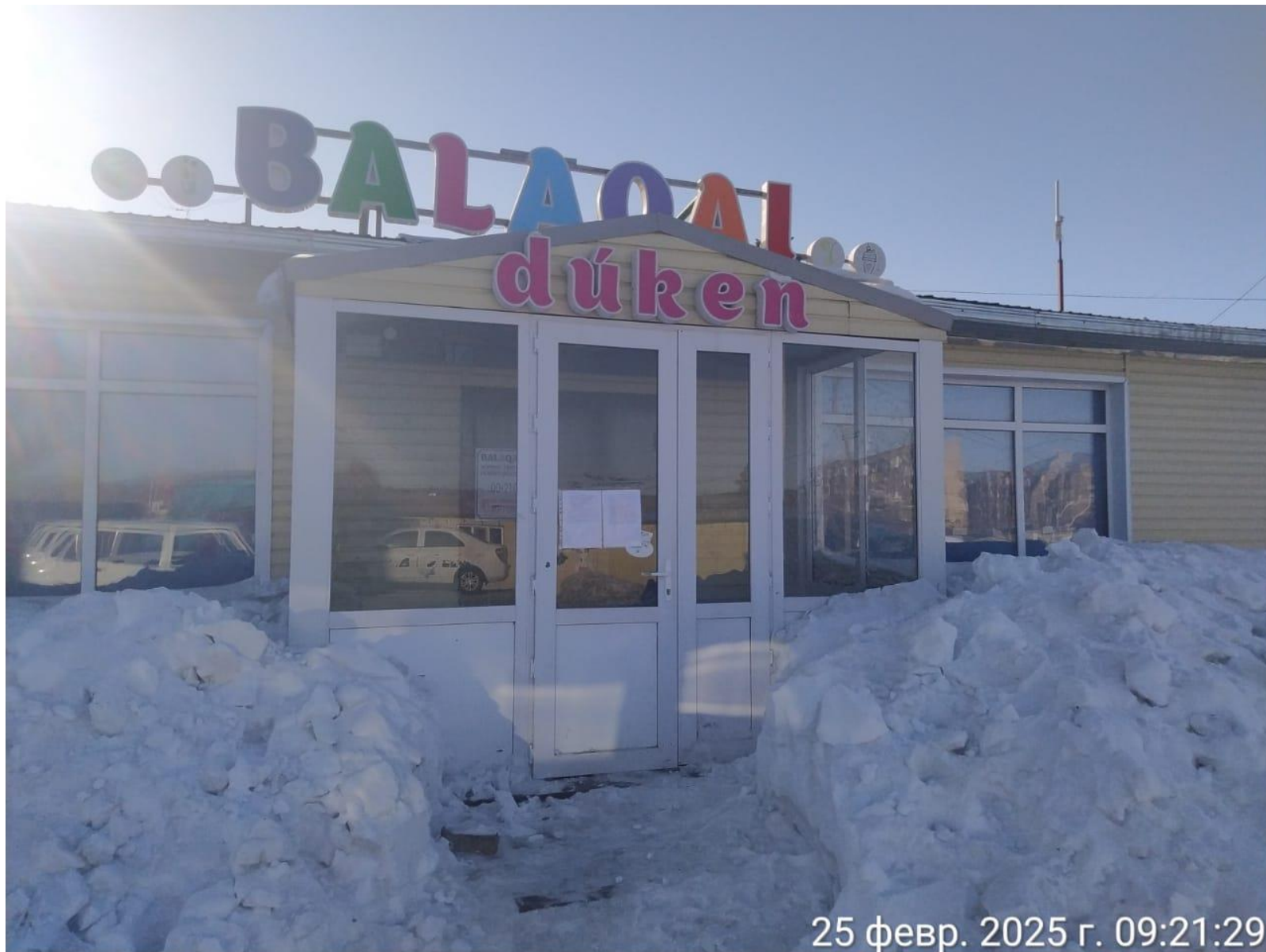
Магазин «BALAQAI» поселка Ауэзов Жарминского района, области Абай