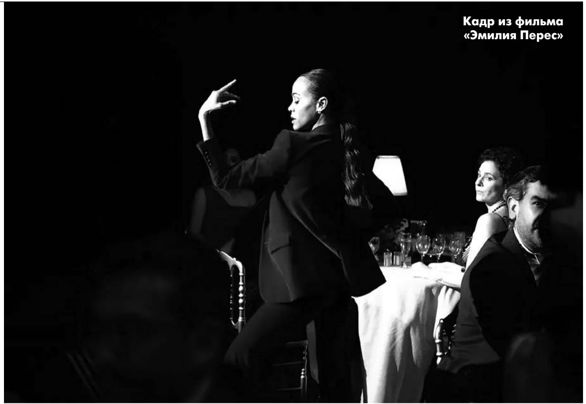
Кадр из фильма «Эмилия Перес»