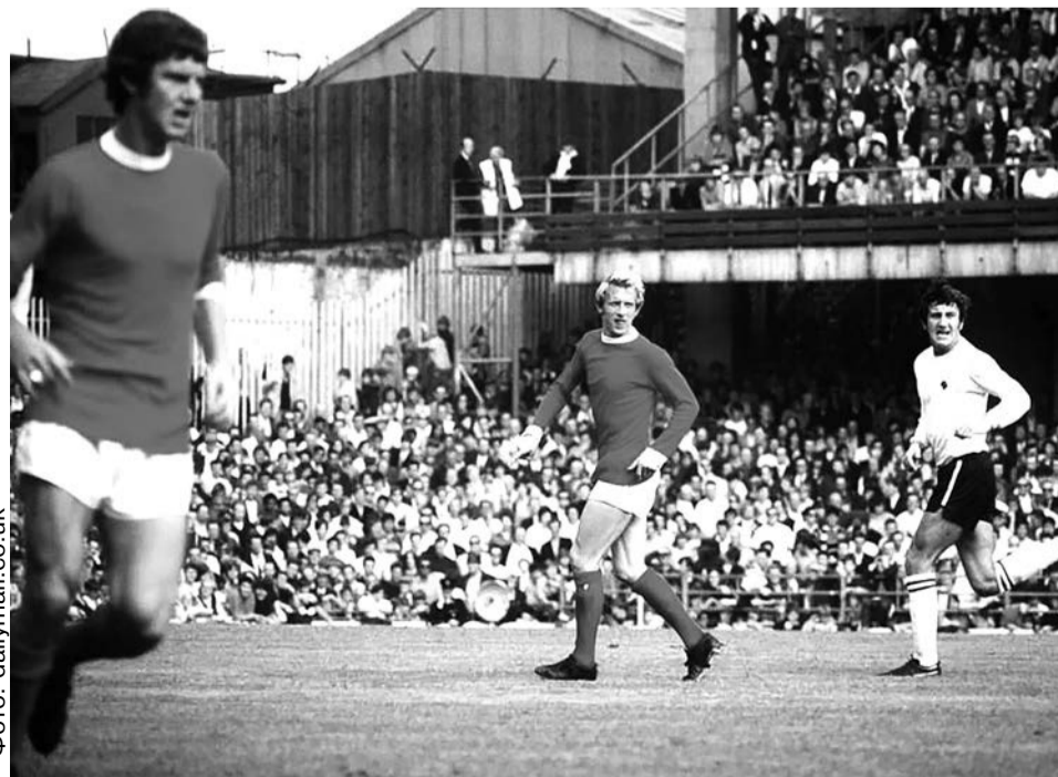
Лоу в составе команды Манчестер Юнайтед

В тот период великий клуб лихорадило. После мюнхенской трагедии (в 1958-м самолет с игроками «Юнайтед» разбился в аэропорту Мюнхена) новая команда все еще строилась заново. И немудрено, что пятикратные чемпионы страны боролись за выживание. Но с Лоу дела у них потихоньку пошли на лад. В том же сезоне-1962/1963 благодаря Денису «Красные дьяволы» даже завоевали спустя 15 лет Кубок Англии (джокер забил единственный и победный мяч в полуфинале, а в решающей схватке с «Лестером» открыл счет и предопределил успех «Манчестера»). В следующем году Лоу отличится 46 раз в 42 матчах (это достижение до сих пор не покорилось ни одному резиденту «Юнайтед») и заслуженно прижмет к груди «Золотой мяч», став первым и последним на сегодня шотландским футболистом, удостоенным престижнейшей награды. При этом забавно, что его клуб, несмотря на резвость фронтмена (Лоу успел еще и в легендарном «матче века» на «Уэмбли» в составе сборной мира засадить один мячишко англичанам, которые, кстати, не смогли пробить нашего Льва Яшина) протелет тогда мимо трофеев.