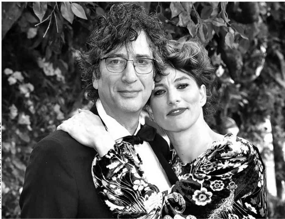
Нил Гейман и Аманда Палмер