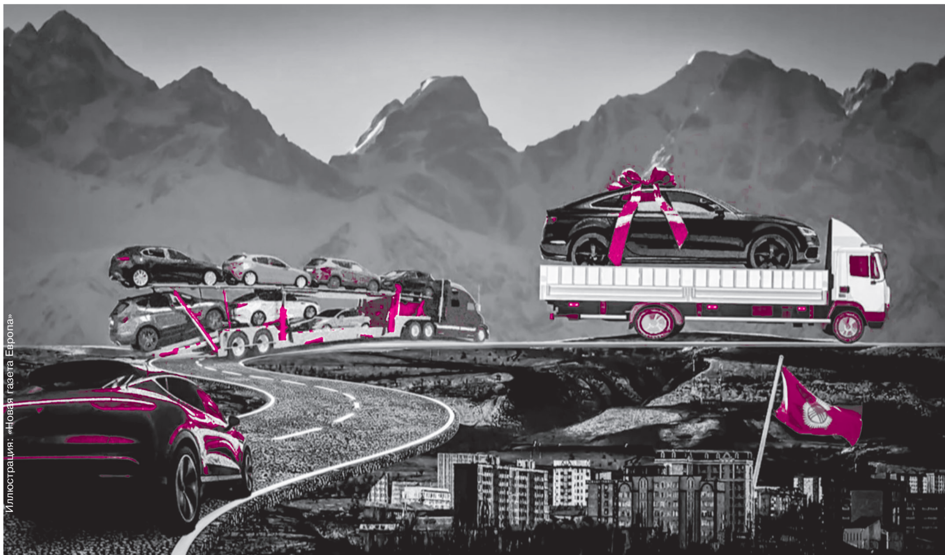
Иллюстрация: «Новая газета Европа»

ДРУЗЬЯ И РОДСТВЕННИКИ ПРЕЗИДЕНТА ЖАПАРОВА УЧАСТВУЮТ В КОНТРАБАНДЕ АВТОМОБИЛЕЙ КЛАССА ЛЮКС В РОССИЮ