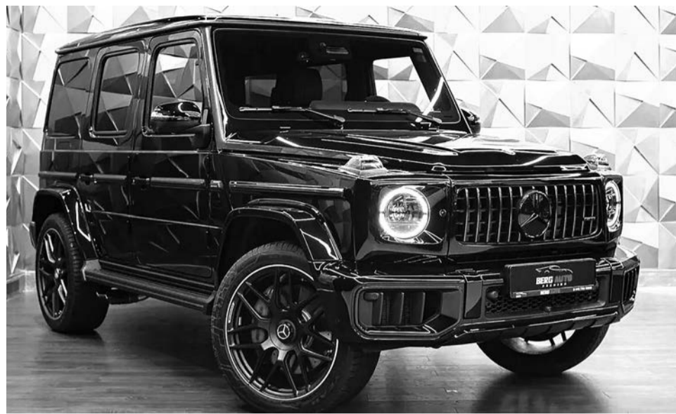
Mercedes-Benz G-Класс AMG 63 AMG

«У нас сложная логистика из-за ограничений, но возможно всё!» — заверил продавец, добавив, что у него есть связи по всему миру, так как «раньше мы все работали в официальных салонах известных брендов».