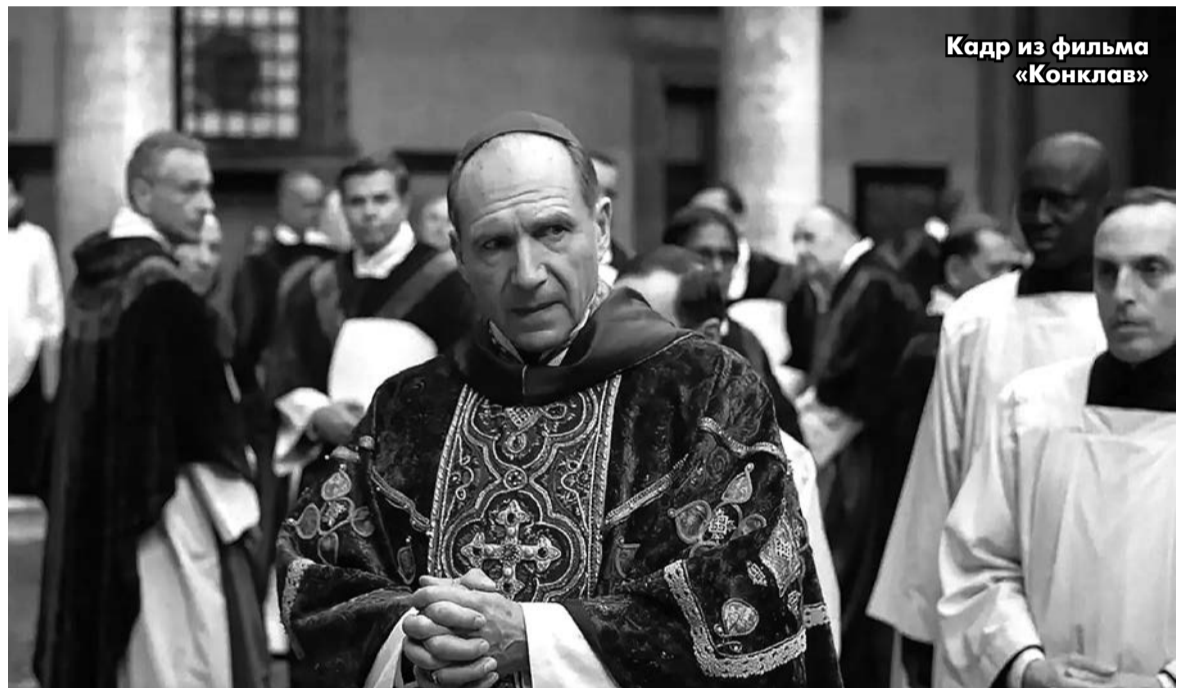
Кадр из фильма «Конклав»