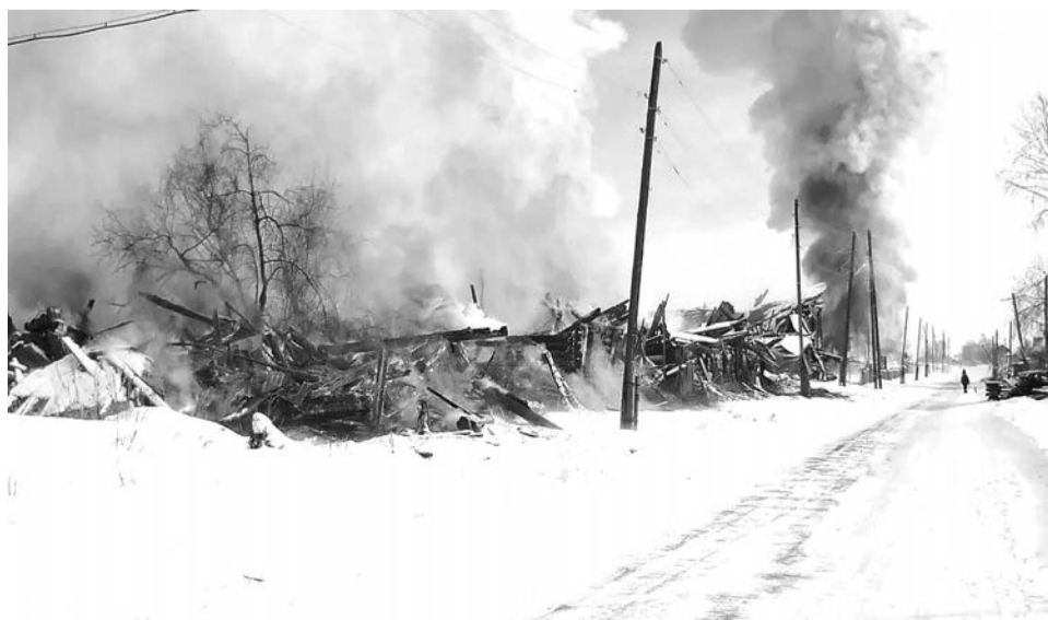
Сожжение села Кежмы на Ангаре перед затоплением этих мест