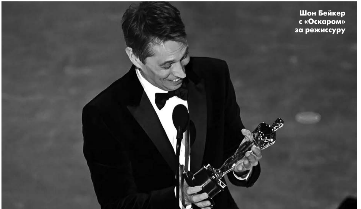
Шон Бэйкер с «Оскаром» за режиссуру