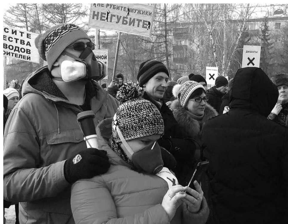
На одном из красноярских митингов за экологию. Когда их еще не запретили