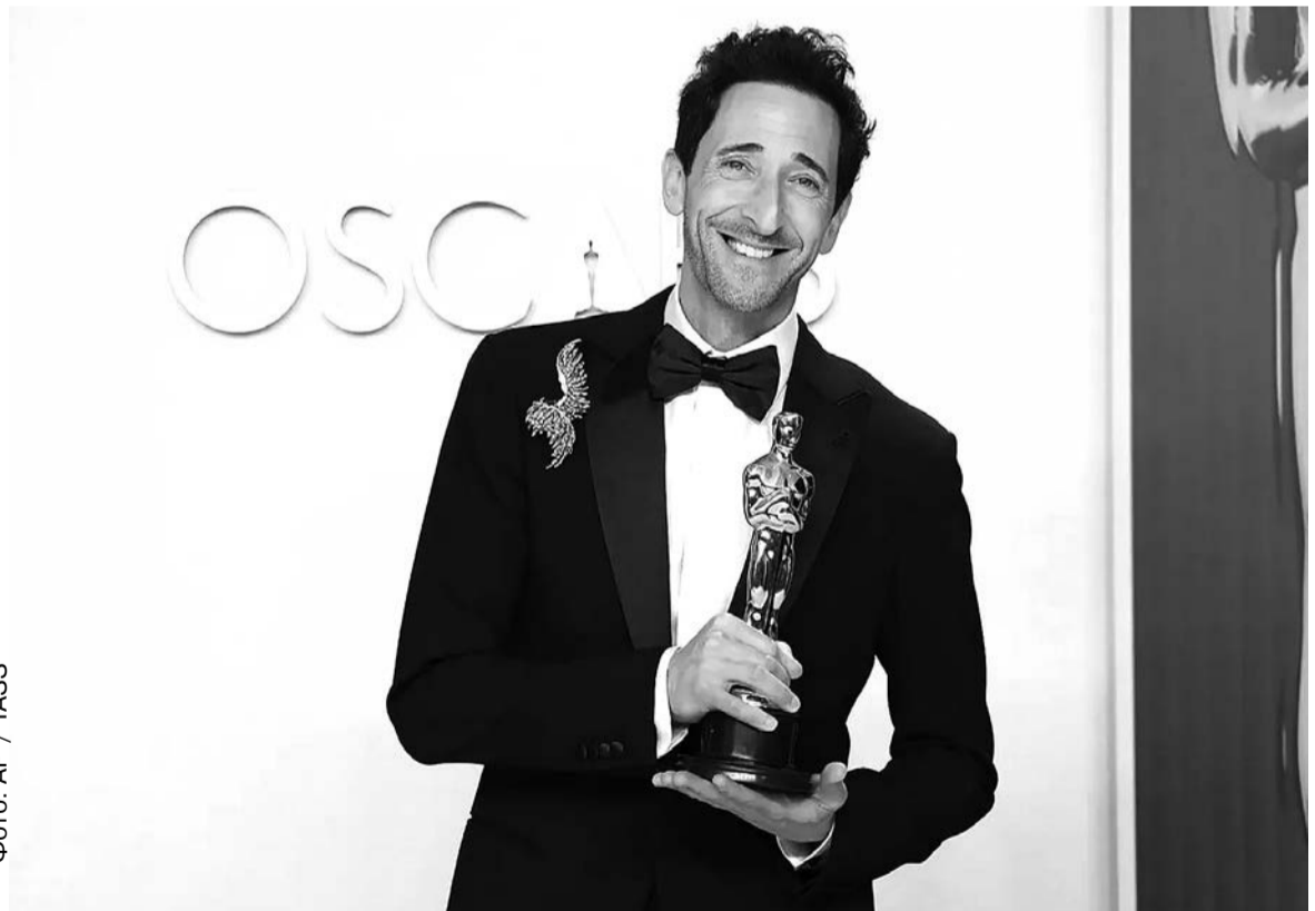
Эдриан Броуди с наградой за лучшую мужскую роль

P.S. «Оскар» стремится соответствовать прогрессивным умонастроениям. Поэтому среди награжденных должны быть люди разных рас и цвета кожи. Должны быть подняты острые политические темы. В категории «Лучший документальный фильм» награду получила картина «Нет другой земли» об арабо-израильском конфликте. Эта картина, снятая международной командой, получила и на «Берлинале»-2024 награды. А лучшим анимационным фильмом стал «Поток» — путешествие котика и его друзей по реке жизни без лишних слов обошел гигантов «Диснея». Это первый «Оскар» в истории Латвии.