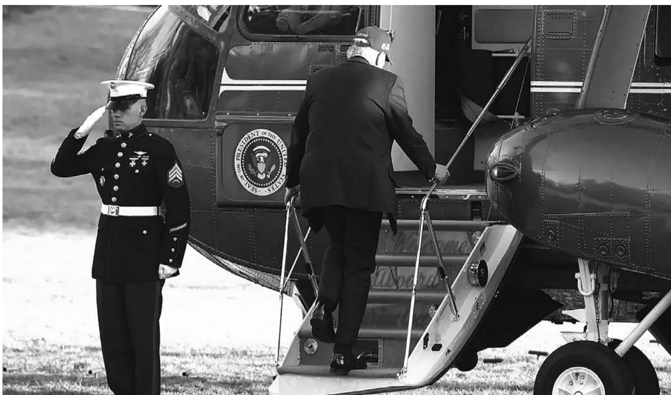
Трамп покидает Вашингтон после провальных переговоров с Зеленским