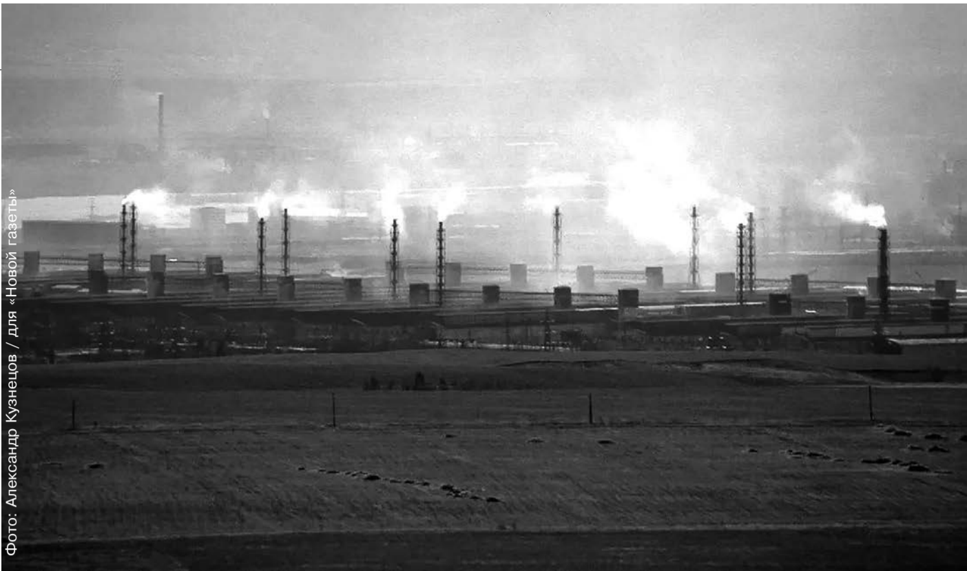
Красноярский алюминиевый завод (КраЗ)