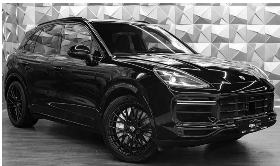
Porsche Cayenne Turbo

Это расследование — часть проекта Forbidden Stories. Проект существует для того, чтобы доводить до конца истории, начатые журналистами, которые ока-