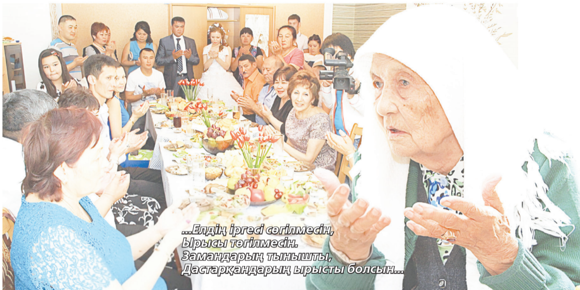
...Елдің іргесі сәгілмесін, Ырысы төгілмесін. Замандарың тынышты, Дастарқандарың ырысты болсын...