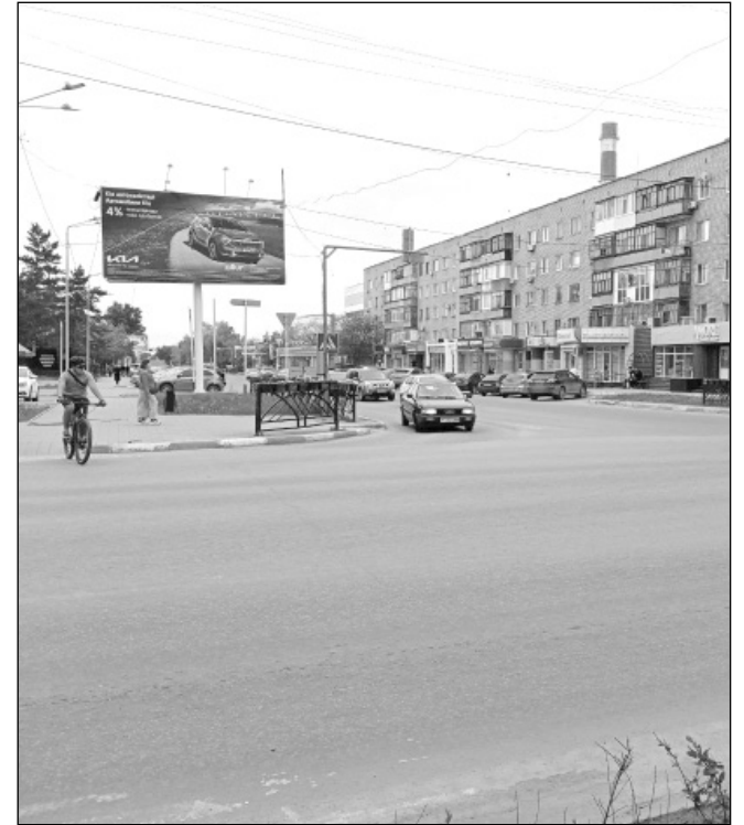
...наткнутся на пешеходов