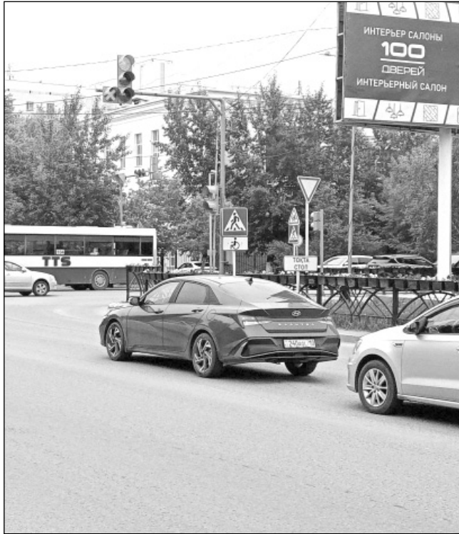
Сейчас водители завернут направо и...