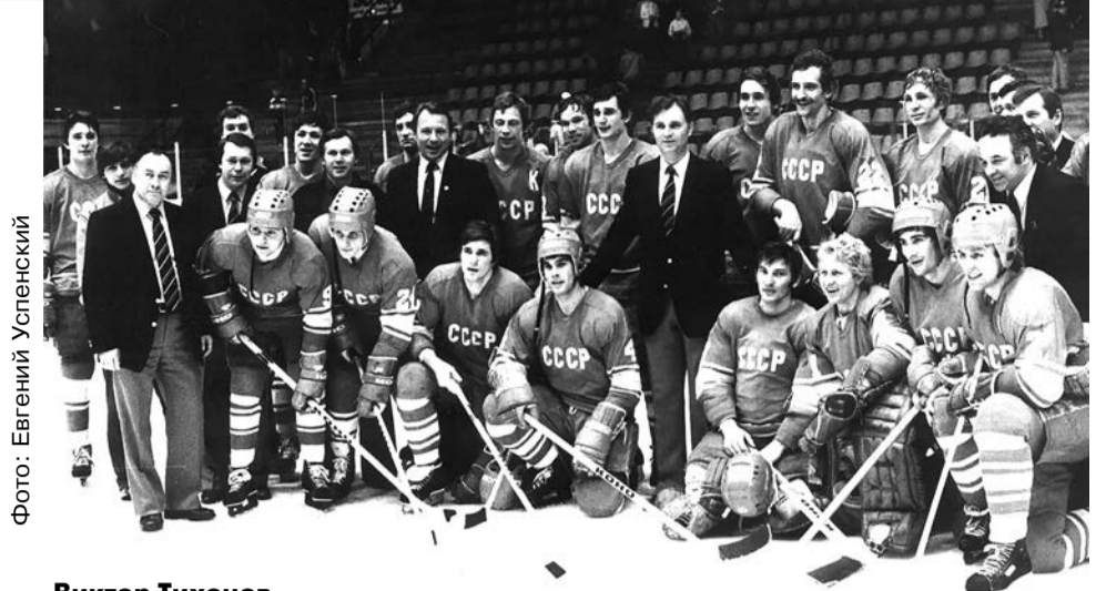
Виктор Тихонов и его золотая сборная

Нет, у него еще оставались силы вкладываться в развитие ЦСКА в качестве президента клуба, он по-прежнему жил хоккеем, но хоккей уже обходился без него. Конечно, Виктор Васильевич с годами подобрел и помягчел, он вообще не был «человеком в футляре» — и с театром «Современник»