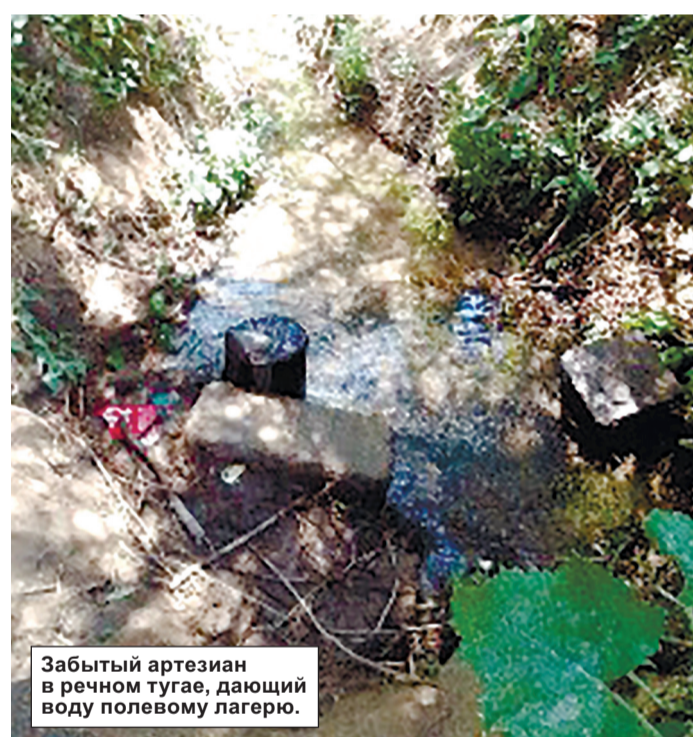
Забывтый артезиан в речном тугае, дающий воду полевому лагерю.

этого было найдено 46 фрагментов. Всего около 100 строк и 2 тысячи знаков. На каждом кирпичике размещалось по 250 знаков в 7-8 строках арамейским алфавитом. Это один из восточных диалектов древнеиранского языка».