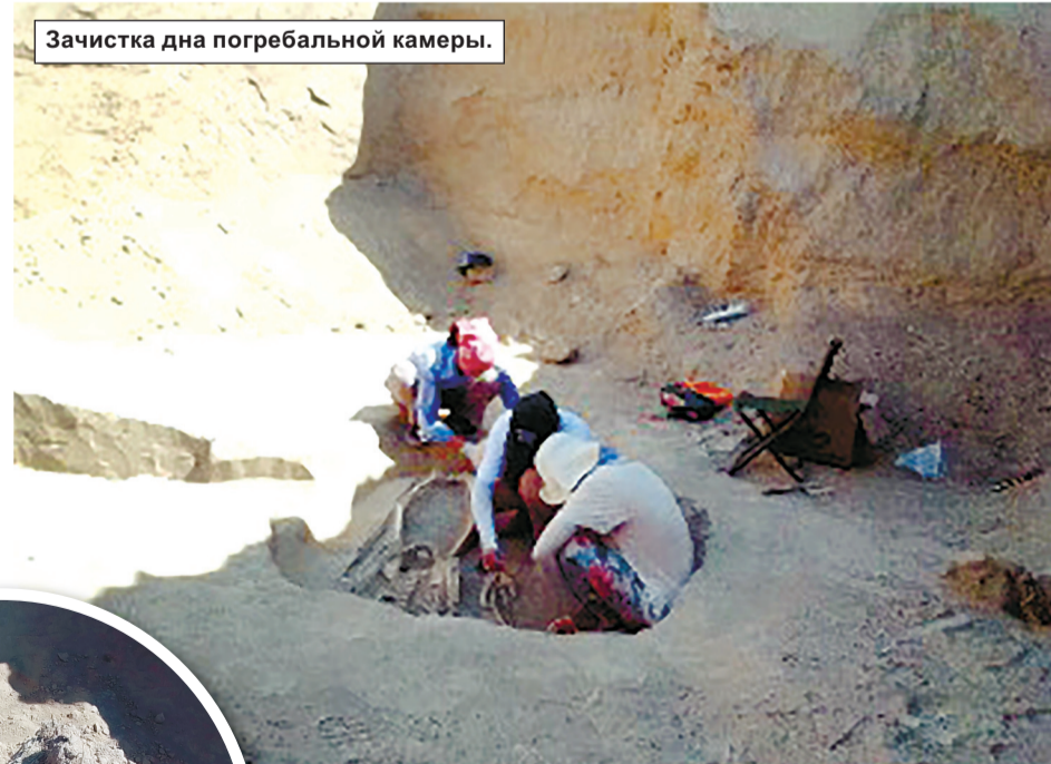
Зачистка дна погребальной камеры.

зачищали. Ничего интересного. И вдруг обнажились очертания костей. Тут появился азарт. Заметила, что у профессора тоже. Находка оказалась очень значимой. То, что мы это сделали