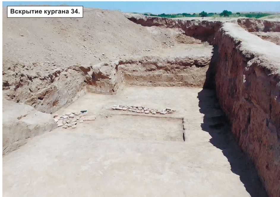
Вскрытие кургана 34.