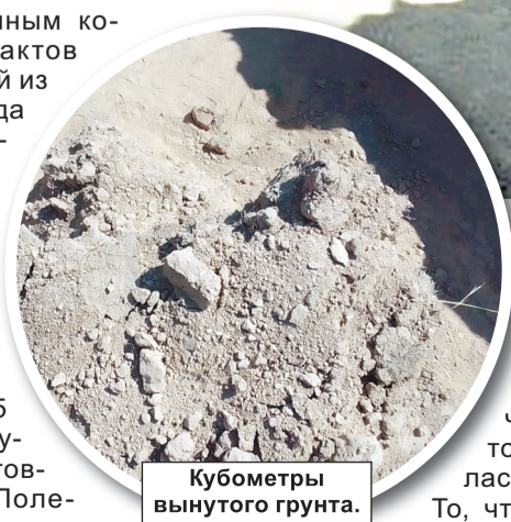
Кубометры вынутаго грунта.