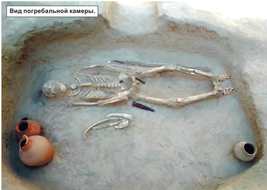
Вид погребальной камеры.

верх арки, или закладные, укладываемые в основание зданий. В 2020 году раскопали целый текст, расшифрованный как запись об основании города государства Кангюй на землях номадов. Эта версия наиболее правдоподобна. В тексте зафиксировано историческое событие: правители Самарканда, Бухары, Кеша (Карши), Чача прибыли в этот город с сокровищами - подарками владетелю. Скорее всего, это было прибытие правителей, подконтрольных Кангюй территорий, с подарками».