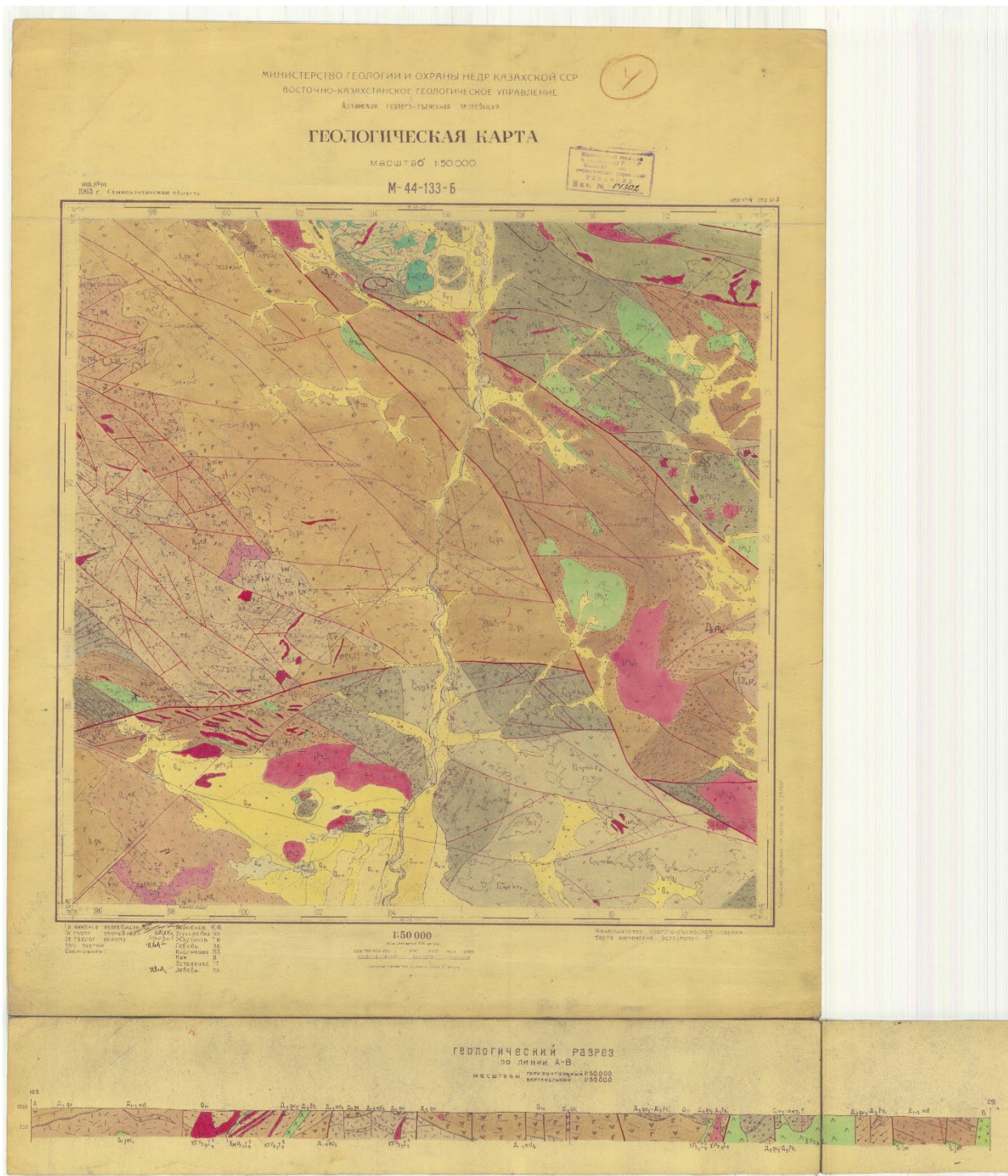
Рисунок 2. Карта геологической изученности