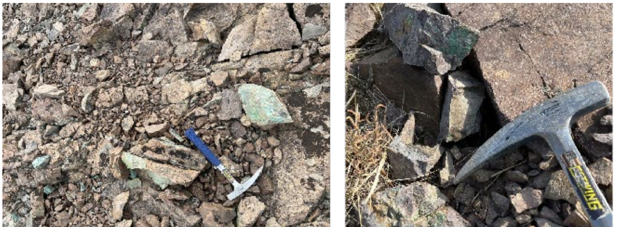
Рисунок 4. Зона непрерывной минерализации, обнаруженная в 2024 году

Наибольшая интенсивность минерализации наблюдается в верхней части левого горного массива. В правой части гор минерализация также присутствует, но в меньшей степени, при этом характер её распространения на глубине остаётся неопределённым.