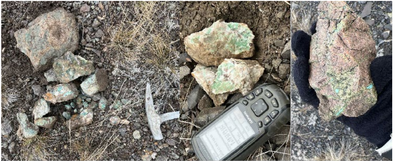
Рисунок 3. Минерализованные породы, обнаруженные в 2024 году

В центрально-западной части гор была обнаружена зона непрерывной минерализации, протяжённостью не менее 550 м и шириной около 10 м (Рис. 4). Непрерывность минерализации в простирании свидетельствует о высокой вероятности наличия рудных тел на глубине.