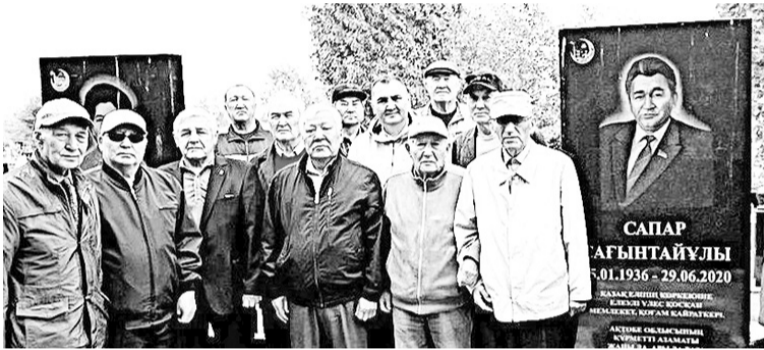
День памяти. 29 июня 2025 года

Прошло пять лет как Большой человек ушел из жизни.